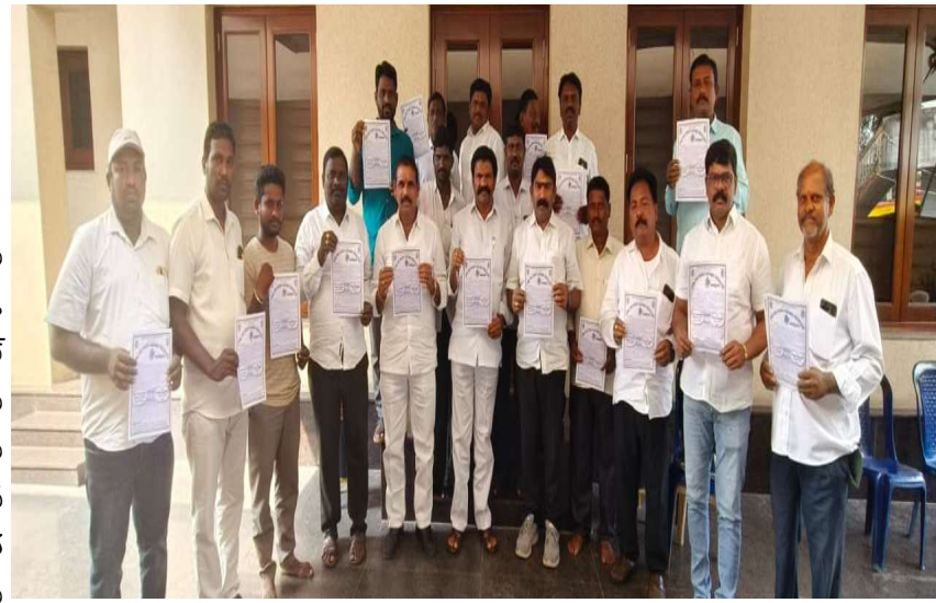
ఖమ్మం ప్రతినిధి ప్రజా జ్యోతి

- యాదవ బంధుమిత్రుల వనభోజనాల కరపత్రాల పంపిణీ కార్యక్రమంలో అఖిల భారత యాదవ మహాసభ నాయకులు