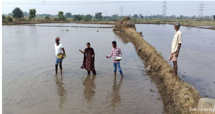
-కూసుమంచి మండల వ్యవసాయ శాఖ అధికారి. రామడుగు వాణి