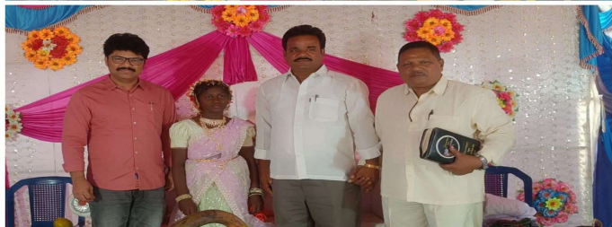
ప్రజా జ్యోతి మధిర