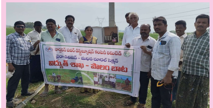
మధిర ఆర్ సి ప్రజా జ్యోతి