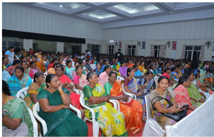
-ప్రతి కుటుంబం లభి పొందేలా ప్రజా ప్రభుత్వ పథకాలు -ఖమ్మం రూరల్ మండలంలోని మద్ది ఎల్లారెడ్డి ఫంక్షన్ హాలులో నిర్వహించిన ప్రజాపాలన విజయోత్సవ కార్యక్రమం నిర్వహణ