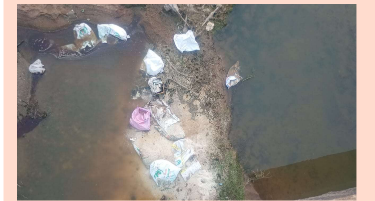
మధిర ఆర్పి ప్రజా జ్యోతి

ఏరూపాలెంమండలం మినవోలు కట్టలేరు బ్రిడ్జి పై పడి ఉన్న రేషన్ బియ్యాన్ని గమనించగా బ్రిడ్జి కింద ఉన్న ఏటి లో సుమారు 7 కింటల అక్రమ రేషన్ బియ్యం వృధాగా నీటి పాలు చేసిన సంఘటన మంగళవారం చోటుచేసుకుంది. స్థానికులు,వాహనదారులు తెలిపిన వివరాల ప్రకారం తెలంగాణ నుంచి ఆంధ్ర ప్రాంతానికి ప్రతిరోజు ఆటోలపై, టీవీఎస్ వెహికల్స్ పై అక్రమ రేషన్ బియ్యం డ్రైలి తరలిస్తూ ఉంటారని ఇటువంటి వారిపై పలుమార్లు రెవెన్యూ అధికారులకు,పోలీసు సిబ్బందికి తెలిపిన చర్యలు తీసుకోకపోవడం గమనార్హం. అదే విధంగా మంగళవారం కోట బియ్యం తరలిస్తున్న వాహనదారుడు పోలీసు వాహనాలు చెకింగ్ చేస్తున్నారని అనుమానంతో రేషన్ బియ్యాన్ని మినవోలు కట్టలేరు లో పడేసి పారిపోయి ఉంటాడని స్థానికులు తెలియజేశారు. ఇప్పటికైనా రెవెన్యూ సిబ్బంది పోలీస్ శాఖ నిఘా ఏర్పాటు చేసి ప్రతిరోజు అర్ధరాత్రి అక్రమంగా తరలిస్తున్న రేషన్ బియ్యాన్ని కట్టి చేయాలని ప్రజలు కోరుతున్నారు.