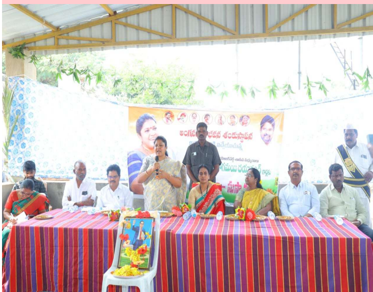
కల్లూరు నవంబర్ 26 (ప్రజా జ్యోతి):