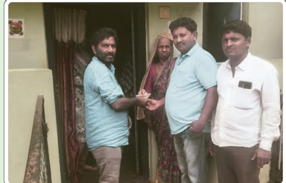
ఇల్లందు, నవంబర్ 3, ప్రజాజ్యోతి: