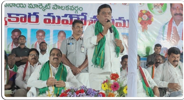
తెలంగాణ రాష్ట్ర సాధన కోసం కెసిఆర్ అసలు పోరాడలేదని, పార్లమెంట్ లో తెలంగాణ బిల్లు పెట్టిన రోజు ఎక్కడ ఉన్నాడని ప్రశ్నించారు.