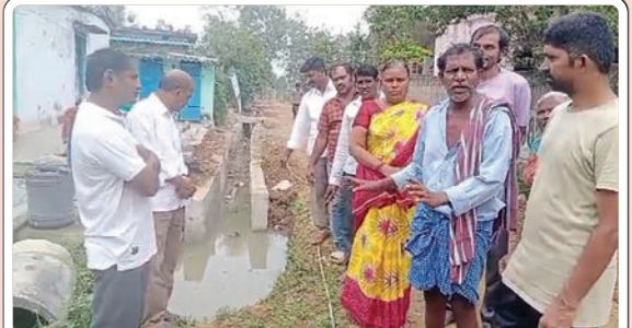
బూర్గంపహాడ్, నవంబర్ 3, ప్రజాజ్యోతి: