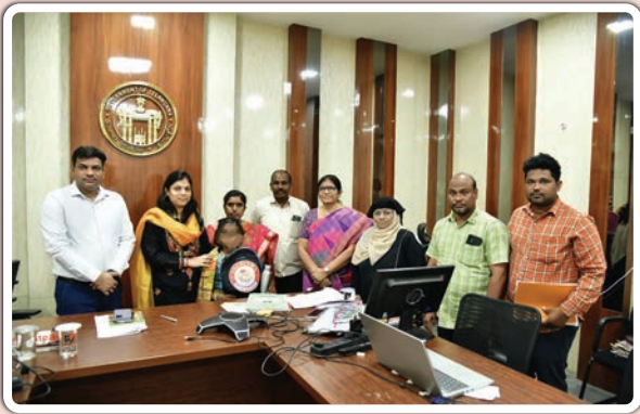
ప్రజాజ్యోతి కరీంనగర్ బ్యూరో: