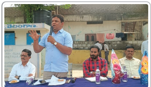
జమ్మికుంట, నవంబర్ 2, ప్రజాజ్యోతి:

సదస్సు ప్రతి కార్మికుడు బీమా తప్పక చేసుకోవాలి మున్సిపల్ కమిషనర్ మహమ్మద్ అయాజ్