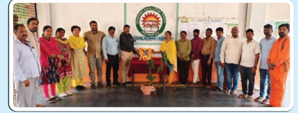
ఇల్లందు / నవంబర్ 28 (ప్రజాజ్యోతి):