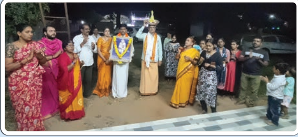
అశ్వారావు పేట, నవంబర్ 28, ప్రజాజ్యోతి:

కార్తీక మాసం ఆఖరి గురువారం కావడంతో పోటెత్తిన భక్తులు