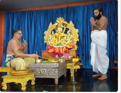
భద్రాచలం టౌన్, నవంబర్ 26 (ప్రజాజ్యోతి)

భద్రాచలం శ్రీసీతారామ చంద్రస్వామి దేవస్థానంలో మంగళవారం సీతారాములకు అర్చకులు నిత్యకల్యాణం నిర్వహించారు. తెల్లవారుజామున స్వామివారికి సుప్రభాత సేవ, ఆరాధన, ఆరగింపు, సేవాకాలం, నిత్యహోమాలు, నిత్యబలిహారణం తదితర నిత్యపూజలు నిర్వహించారు. గాలిగోపురానికి అభిముఖంగా ఉన్న ఆంజనేయస్వామివారికి ఉదయం పంచామృతాభిషేకం చేసి తమలపాకులు, సింధూరంతో పూజలు చేశారు. అనంతరం స్వామివారి నిత్యకల్యాణ మూర్తులను బేడా మండపానికి తీసుకువచ్చి నిత్యకల్యాణం నిర్వహించారు. కల్యాణంలో పాల్గొన్న జంటలకు ప్రసాదాలు, శేషపస్తాలు అందజేశారు.