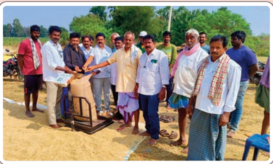
చంద్రగోండ, నవంబర్ 26 (ప్రజాజ్యోతి):