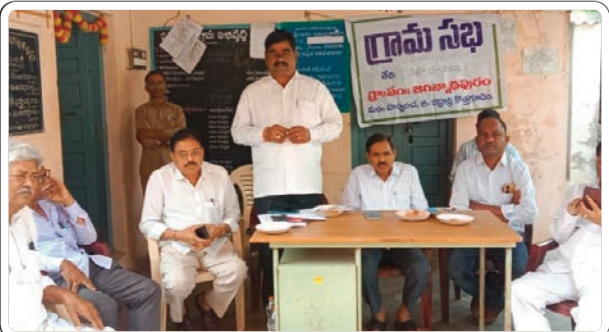
పాల్వంచ (రూరల్), నవంబర్ 26, ప్రజాజ్యోతి: