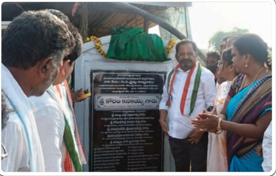
బేకులపల్లి, నవంబర్ 26, ప్రజాజ్యోతి:

సీసీ రోడ్లు, సైడ్ డ్రైనేజ్ 25 లక్షలతో శంకుస్థాపన