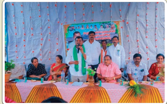
చంద్రగోండ, నవంబర్ 26 (ప్రజాజ్యోతి):