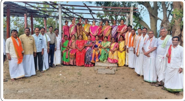
చొప్పదండి, నవంబర్ 25 (ప్రజాజ్యోతి):