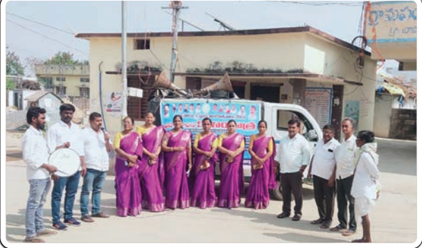
చొప్పదండి, నవంబర్ 25 (ప్రజాజ్యోతి):