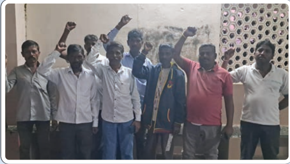
చిగురుమామిడి నవంబర్ 25 (ప్రజాజ్యోతి)