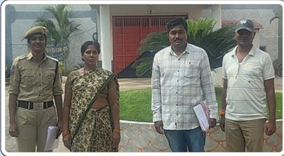
రామగిరి, నవంబర్ 25 (ప్రజాజ్యోతి):