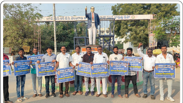
కోరుట్ల, నవంబర్ 22, ప్రజాజ్యోతి