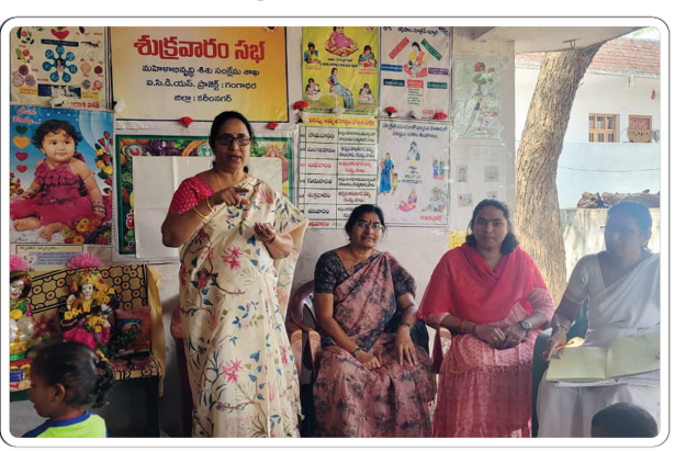
చొప్పదండి, నవంబర్ 22 (ప్రజాజ్యోతి):