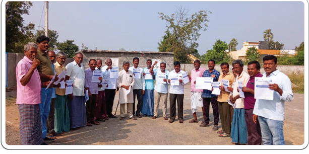
చొప్పదండి, నవంబర్ 22 (ప్రజాజ్యోతి):