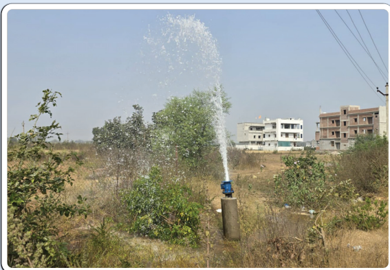
కోరుట్ల, నవంబర్ 22 ప్రజాజ్యోతి

ప్రతి ఇంటికి స్వచ్ఛమైన తాగు నీరు అందించాలనే లక్ష్యంతో గత తెలంగాణ రాష్ట్ర ప్రభుత్వం పెద్ద మొత్తంలో నిధులు ఖర్చు చేసి మిషన్ భగీరథ పైకప్పులు వేసింది. కానీ తాగు నీటి వృధాను అరికట్టడంలో అధికారలు నిర్లక్ష్యం ప్రదర్శిస్తున్నారు. వారి నిర్లక్ష్యం కారణంగా మిషన్ భగీరథ నీరు వృధాగా పోతున్నాయి. శుక్రవారం కోరుట్ల యుజిసీ పూర్వ మధ్యలో మిషన్ భగీరథ పథకంలో బాగంగా వేసిన తాగునీటి పైపు లైన్ లీకేజీ దానిలో నుంచి నీరు వృధాగా పోతున్నాయి. కానీ దీని గురించి ఎక్కడా అధికారి పట్టించుకోవడం లేదు. ప్రజా ప్రతినిధులు సైతం పట్టించుకోవడం లేదని స్థానికులు ప్రజలు ఆరోపిస్తున్నారు.