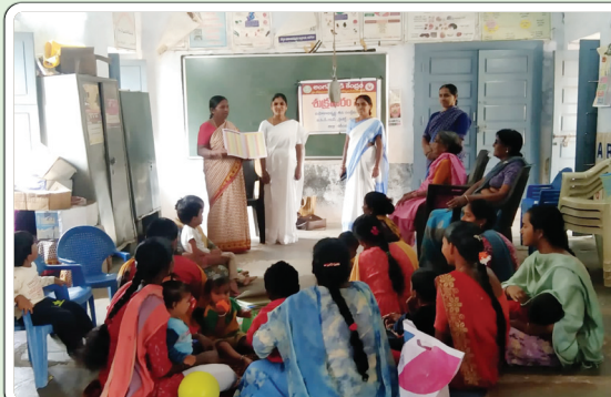
చొప్పదండి, నవంబర్ 22 (ప్రజాజ్యోతి):