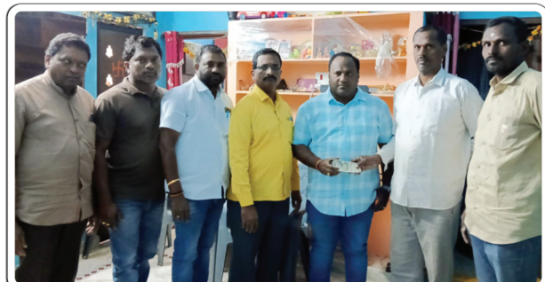
కోరుట్ల, నవంబర్ 22 ప్రజాజ్యోతి