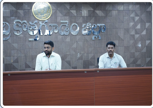
కొత్తగూడెం కలెక్టరేట్, నవంబర్ 21 (ప్రజాజ్యోతి):