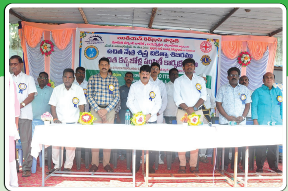
భద్రాచలం, నవంబర్ 21 ప్రజాజ్యోతి:

ఉచిత కళ్లజోళ్ల పంపిణీలో ఎమ్మెల్యే తెల్లం