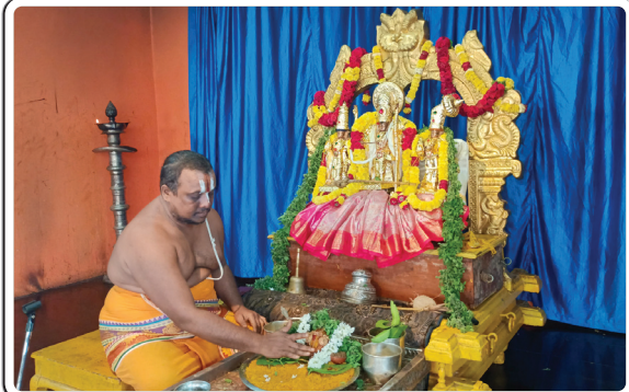
భద్రాచలం టౌన్, నవంబర్ 18 (ప్రజాజ్యోతి)

భద్రాచలం శ్రీ సీతారామచంద్రస్వామివారి దేవస్థానంలో సోమవారం స్వామివారు ముత్తంగి అలంకరణలో దర్శనమిచ్చారు. తెల్లవారుజామునే అర్చకులు ఆలయతలుపులు తెరిచి స్వామివారికి సుప్రభాత సేవ నిర్వహించారు. అనంతరం ఆరాధన, సేవాకాలం, నిత్య బలిహారణం, అభిషేకం తదితర నిత్య పూజా కార్యక్రమాలు యథావిధిగా జరిపారు. అనంతరం బేదా మండపంలో ఏర్పాటు చేసిన ప్రత్యేక వేదికపై రామయ్య నిత్యకల్యాణాన్ని కార్తీకమాసం సందర్భంగా చిత్రాకుట మండపంలో దేవస్థానం ఆధ్వర్యంలో ఏర్పాటు చేసిన సత్యనారాయణ స్వామి