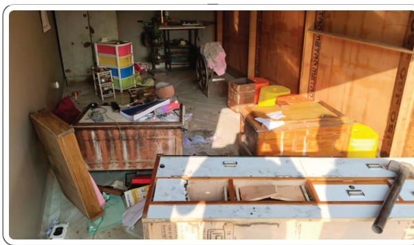
రెండు జతల వెండి మెట్టలు, ముద్ద బెజ్జారపు గంగాధర్ ఫిర్యాదు మేరకు వెండి ఇతర వస్తువులను ఎత్తుకెళ్లారని మల్లాపూర్ పోలీసులు కేసు నమోదు

చేసి దర్యాప్తు చేపట్టారు. మండల కేంద్రంలోని అంబేద్కర్ ఆవరణ ప్రాంతంలో కూత వేస్తే నలుమూలల నుండి ప్రజలు వచ్చే ప్రాంతంలో దొంగతనం జరగడంతో ప్రజలు భయభ్రాంతులకు గురయ్యారు. మండల కేంద్రంలో సీసీ కెమెరాలు పనిచేయడం లేదని సీసీ కెమెరాలు పనిచేసే ఉంటే దొంగలను పట్టుకోవడానికి సులువుగా ఉండేదని ప్రజలు బహిరంగంగానే మాట్లాడారు. త్వరగా పోలీసు వారు దొంగలను పట్టుకుని దొంగల బెడదల నుండి ప్రజలను కాపాడాలని కోరారు.