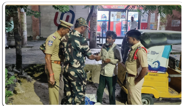
కరీంనగర్ క్రైం, నవంబర్ 16, ప్రజాజ్యోతి