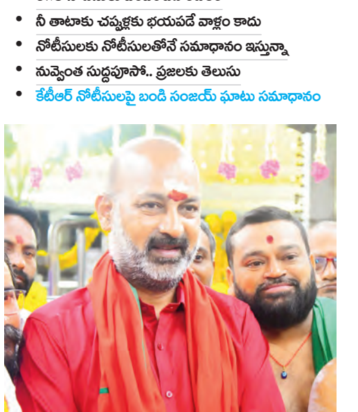
హైదరాబాద్, అక్టోబర్ 23 (ప్రజాజ్యోతి):

కేంద్ర చోంకాకు సహాయ మంత్రి బండి సంజయ్కు లీగల్ నోటీసులు పంపించారు. తన పరువుకు నష్టం కలిగించేలా వ్యాఖ్యలు చేశారని పేర్కొన్నారు. వారం రోజుల్లో బేషరతుగా క్షమాపణలు చెప్పకపోతే లీగల్ యాక్షన్ తప్పదని హెచ్చరించారు. బండి సంజయ్ కామెంట్స్ నిరాధారమైనవి, తనపై తప్పదు ఆరోపణలని వెల్లడించారు. ఆయన వ్యాఖ్యలు తన వ్యక్తిత్వాన్ని అవమానపరచేలా ప్రతిష్టను దిగజేస్తూ ఉన్నాయన్నారు. తనను అప్రతిష్ట పాలు చేయాలన్న దురుద్దేశంతోనే ఆయన కామెంట్స్ చేశారని నోటీసులో కేటీఆర్ తెలిపారు. ఎలాంటి ఆధారాలు లేకుండా ఇవ్వసామీరంగా తన పరువుకు భంగం కలిగించే మిగతా 2లో..