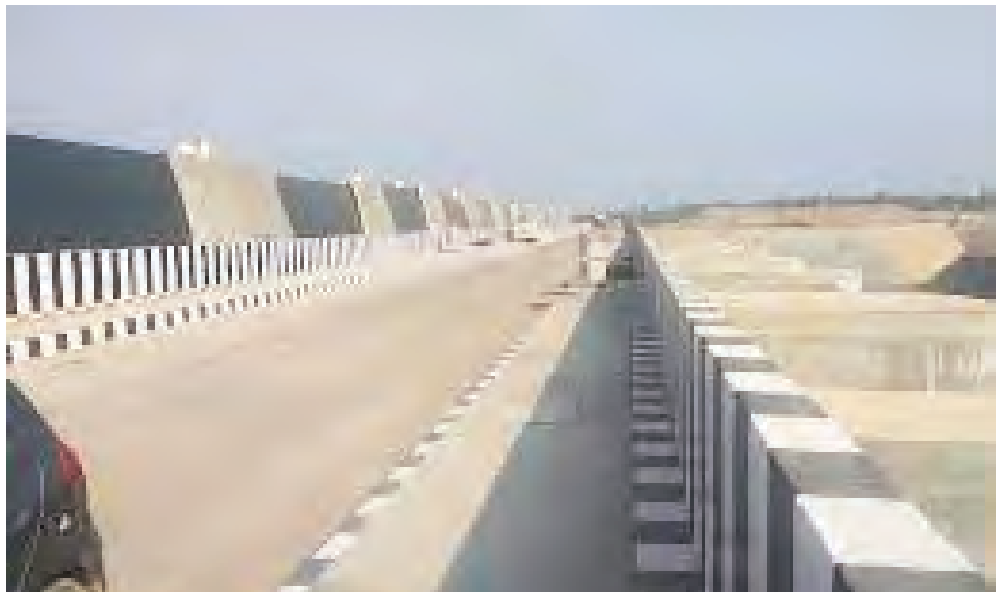
హైదరాబాద్, అక్టోబర్ 23 (ప్రజాజ్యోతి):

డ్యామ్ సేఫ్టీపై కమిషన్ ప్రశ్నల వర్షం కమిషన్ ముందుకు ఈఎన్సీ నాగేందర్