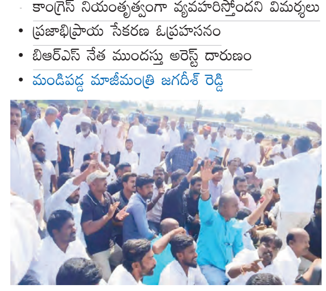
రామన్నపేట, అక్టోబర్ 23 (ప్రజాజ్యోతి):

యాదాద్రి భువనగిరి జిల్లాలోని రామన్నపేటలో తీవ్ర ఉద్రేకత నెలకొన్నది. అదాసి అంబుజా సిమెంట్ కంపెనీ ఏర్పాటుకు వ్యతిరేకంగా స్థానికులు ఆందోళనకు దిగారు. సిమెంటు ఫ్యాక్టరీ ఏర్పాటు కోసం నిర్వహిస్తున్న ప్రజాభివృద్ధి సేకరణను ప్రజలు అడ్డుకున్నారు. పోలీసుల నిర్బంధాలను దాడుకు ఘనకార్యలు, నల్లజైంధాలతో నిరసనకు దిగారు. పర్యావరణవేత్తల పేరుతో అంబుజాకు అనుకూలంగా మాట్లాడేందుకు ఇతర ప్రాంతాల నుంచి వచ్చినవారిని తరమి కొట్టారు. పరిశ్రమ పేరుతో తమ బతుకులను బుగ్గి చేస్తే సహించలేదని వారు హెచ్చరిక చేశారు. కంపెనీ నిర్వాహణకి ఎట్టి పరిస్థితుల్లోనూ ఒప్పుకునేది లేదని తేల్చిచెబుతున్నారు. కాగా, కంపెనీని ఏర్పాటుకు బిఆర్ఎస్ పార్టీ తీవ్రంగా మిగతా 2లో..