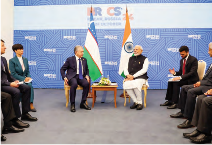
మాస్కో, అక్టోబర్ 23 (ప్రజాజ్యోతి):

ఉగ్రవాదంపై పోరుకు యావత్ ప్రపంచం ఏకతాటిపై నిలవాలని భారత ప్రధాన మంత్రి నరేంద్ర మోడీ పిలుపునిచ్చారు. దీనిపై ద్వంద్వ ప్రమాణాలకు తావివ్వరాదని పరోక్షంగా చైనా తీరును ఎండగట్టారు. కజాఖ్స్థాన్ జరుగుతున్న 16వ బ్రిక్స్ సదస్సు ముగింపు సమావేశంలో మోడీ మాట్లాడుతూ, ఉగ్రవాదం అనే తీవ్ర సమస్యను కలిసికట్టుగానే ఎదుర్కోవలసి ఉంటుందన్నారు. ఇలాంటి అంశాల్లో ద్వంద్వ ప్రమాణాలు సరికాదన్నారు. ఉగ్రవాదం, ఉగ్రవాదులకు నిధుల సరఫరా అనేవి చాలా తీవ్రమైన సమస్యలు. వీటిని చాలా సమర్థవంతంగా ఎదుర్కోవాలి. ఇందుకు అంతా కలిసికట్టుగా పనిచేయాలి' అని మోడీ సూచించారు. ఈ సందర్భంగా ప్రధాన మంత్రి నరేంద్ర మోడీ ఏ దేశం పేరును ప్రస్తావించకపోయినప్పటికీ ఉగ్రవాదాన్ని ప్రేరేపిస్తున్న పాకిస్తాన్ కు చైనా ఆర్థిక సహాయాన్ని ఎండగట్టారు. ప్రపంచ శాంతికి విఘాతం కలిగించే రాజకీయాలపై అప్రమత్తంగా ఉండాలన్నారు. యువశక్తి అతివాదులుగా మారేందుకు ప్రేరేపించడాన్ని సమస్యగా ప్రపంచదేశాలు అడ్డుకోవాలని అన్నారు. అంతర్జాతీయ తీవ్రవాదంపై యూఎన్ కాంప్రహెన్సివ్ కన్వెన్షన్లో ప్రస్తావించిన పెండింగ్ అంశాలపై కూడా అంతా కలిసికట్టుగా పనిచేయాలని సభ్యదేశాలకు మోడీ పిలుపునిచ్చారు. సైబర్ సెక్యూరిటీ అనేది మిగతా 12లో..