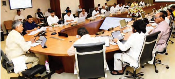
అమరావతి, అక్టోబర్ 23 (ప్రజాజ్యోతి):

దీపావళి నుంచి 3 ఉచిత గ్యాస్ సిలిండర్లు ఇచ్చేందుకు ఎపి మంత్రివర్గం ఆమోదం తెలిపింది. సగటు చెల్లింపిని నిలిపించి కోసుగోలు చేస్తే.. 48 గంటల్లో తిరిగి ఆఫోలోలో పగడు జనుయ్యలా చూడాలని నిర్ణయించారు. ఒకసారి మూడు సిలిండర్లు తీసుకోకుండా ప్రతి నాలుగు నెలలకు ఒక సిలిండర్ ఇవ్వాలని నిర్ణయించారు. ఈ పథకం ద్వారా రాష్ట్ర ప్రభుత్వంపై ఏదాదికీ రూ.2700 కోట్ల భారం పడుతుందని మంత్రివర్గంలో చర్చ జరిగింది. ఉచిత ఇసుక విధానంలో సీనరేజ్, జీఎస్టీ ఛార్జీల రద్దుకు మంత్రివర్గం ఆమోదం తెలిపింది. సీనరేజ్ ఛార్జీల రద్దు వల్ల ప్రభుత్వంపై రూ.264 కోట్ల భారం వేరవేలా వేసారు. ఉచిత ఇసుక లక్ష్యం నెరవేర్చేందుకు సభ్యం భవిష్యత్తును సీఎం చంద్రబాబు చెప్పినట్లు సమాచారం. పట్టా భూముల్లో ఎవరి ఇసుక వారు తీసుకునేందుకు మంత్రివర్గం ఆమోదం తెలిపింది. ఉచిత ఇసుక సరిగా అమలయ్యేలా చూడాలని మంత్రులు, మిగతా 2లో..