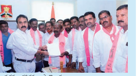
కార్యకర్తలు తదితరులు పాల్గొన్నారు

చేసేవిధంగా ఈ కాంగ్రెస్ ప్రభుత్వం వ్యవహరిస్తుంది అధికారులు రేపు జరిగే ప్రజాభిప్రాయ సేకరణ కార్యక్రమాన్ని వెంటనే రద్దు చేసి , ఈ ప్రాంతం లో సిమెంట్ కంపెనీ వల్ల జరిగే నష్టాలను ప్రభుత్వం దృష్టికి తీసుకెళ్లి కంపెనీ అనుమతి రద్దు చేయాలి ఈ కార్యక్రమంలో పార్టీ నాయకులు