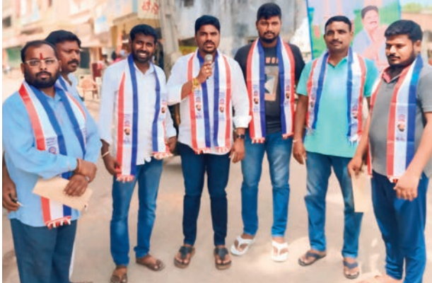
తెలంగాణ రైతులకు ఇచ్చిన మాట ప్రకారం ఎకరాకు 7500 రైతు భరోసా

మిర్యాలగూడ, అక్టోబర్ 19, ( ప్రజాజ్యోతి ):