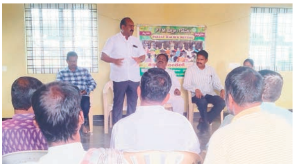
విద్యార్థుల తల్లిదండ్రులు, యువకులు పాల్గొన్నారు.

పాఠశాలల్లోనే చేర్పించాలని కోరారు. ఈ కార్యక్రమంలో ఉపాధ్యాయులు