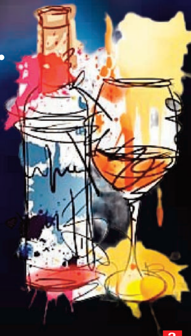
తుంగతుర్తి అక్టోబర్ 16 (ప్రజాజ్యోతి)

బావమరిది: బావా... ఎన్ని రోజులైంది.. మా ఊరోచ్చి పద పద నీకు మంచి పార్టీ ఇస్తా! బావ ఈ టైంలో (రాత్రి 11:00 గంటలు) ఎక్కడికి వెళ్తావో బావమరిది: ఎంత మాటన్నావ్ బావా... మా ఊరోచ్చి, మా మండలంలో ఎప్పుడంటే.. అప్పుడు మండంటే..మండు, గుడుంబా అంటే గుడుంబా. కాకపోతే క్వార్టర్ కు రూ.30 ఎక్కువ బావ. ఇది