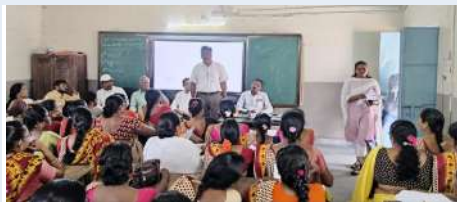
వెంకటాపురం అక్టోబర్ 30 (ప్రజాజ్యోతి) :