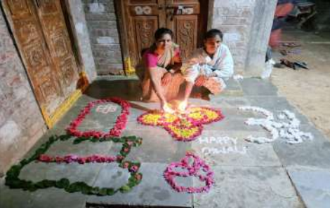
-తరుణి స్వచ్ఛంద సంస్థ ఆధ్వర్యంలో నీటిలో దీపాలు వెలిగించిన గొల్లపల్లి బాలిక సంఘం అమ్మాయిలు