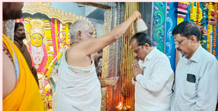
హనుమకొండ జిల్లా ప్రతినిధి: అక్టోబర్ 07, ప్రజా జ్యోతి :

- స్వాగతం పలికిన అర్చకులు, ఆలయ అధికారులు.