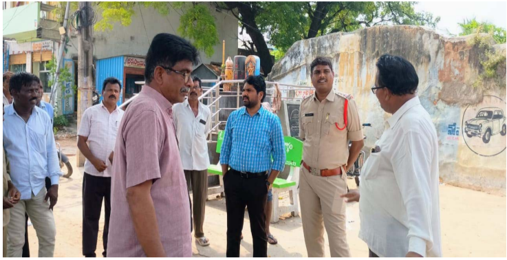
హనుమకొండ జిల్లా కమలాపూర్ అక్టోబర్ 07 ( ప్రజాజ్యోతి):

కమలాపూర్ మండల కేంద్రంలోని తహసిల్దార్, సిఐ, గ్రామ పెద్దలు మరియు సిబ్బంది తో కలిసి సద్గుణ బతుకమ్మ, దసరా నిర్వహించే చెరువు స్థలాన్ని గడి మైసమ్మ గుడిని, మరియు ఇతర ప్రదేశాలను పరిశీలించిన శ్రీయుత మండల పరిషత్ అభివృద్ధి అధికారి గుండె.