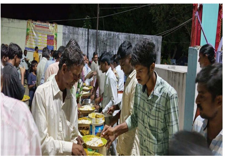
పర్వతగిరి , అక్టోబర్ 07 (ప్రజాజ్యోతి) :

పర్వతగిరి మండల కేంద్రం వేణుగోపాలస్వామి యూత్ ఆధ్వర్యంలో దేవి నవరాత్రి ఉత్సవాలు నిర్వహిస్తున్నారు. ఈ కార్యక్రమంలో భాగంగా ఐదవ రోజు ప్రత్యేక పూజలు చేసి అనంతరం మహా అన్నప్రసాద కార్యక్రమాన్ని నిర్వహించారు. అమ్మలగన్న అమ్మ మూలపుటమ్మ దుర్గామాత దేవి శరన్నవరాత్రుల సందరంగా 5వ రోజు మహా అన్నప్రసాద విచారణ కార్యక్రమాన్ని చేపట్టామని వేణుగోపాల స్వామి యూత్ కమిటీ సభ్యులు తెలిపారు. ఈ కార్యక్రమంలో యూత్ సభ్యులు, గ్రామ ప్రజలు, భక్తులు అధిక సంఖ్యలో తదితరులు పాల్గొన్నారు.