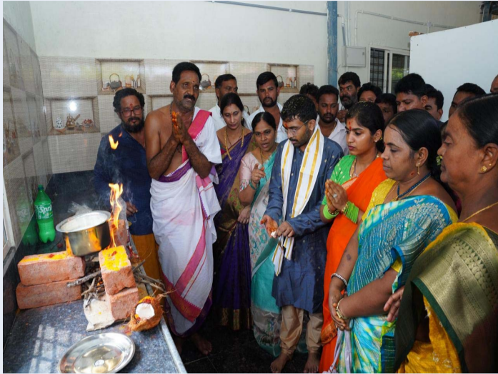
పాలకుర్తి అక్టోబర్ 07 (ప్రజా జ్యోతి)