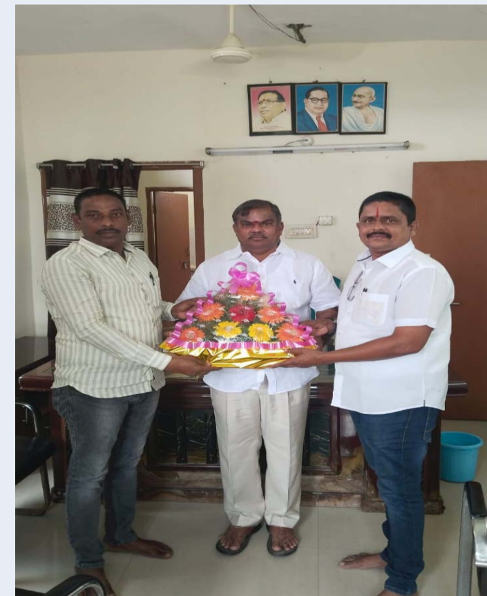
ఆత్మకూరు, అక్టోబర్ 07, (ప్రజా జ్యోతి):

-రేపు బుధవారం నూతన కమిటీ ప్రమాణ స్వీకారం