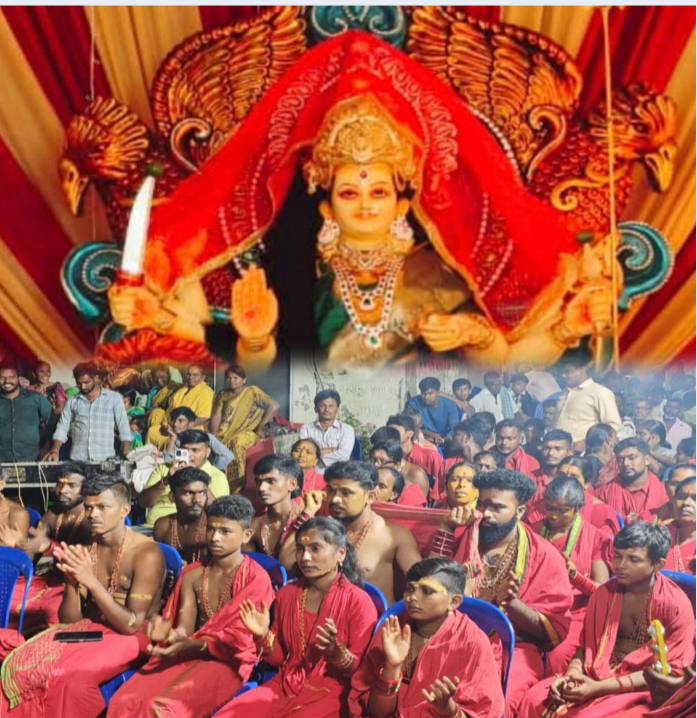
డోర్నకల్ అక్టోబర్ 7 (ప్రజాజ్యోతి) :

దసరా శరన్నవరాత్రుల మహోత్సవంలో భాగంగా డోర్నకల్ మండలంలోని చిలుకోడు గ్రామంలో గుండాబజార్ నవరాత్రి ఉత్సవాల్లో 5వ రోజు మహాచండి అవతారంలో దర్శనమిస్తూ కోరిన కోరికలు నెరవేర్చే తల్లిగా ఆయురారోగ్యాలతో అష్టేశ్వరాలతో పాడిపంటలతో ప్రజలందరూ సుఖిక్షంగా ఉండాలని గుండ బజార్ దుర్గ ఉత్సవ కమిటీ వారు అమ్మవారిని వేడుకున్నారు. అనంతరం భవాని భజన కార్యక్రమాలు రంగ రంగ వైభవంగా జరిగాయి. గుండ బజారు ప్రాంగణంలో భవాని భజన మాలాధారణలో స్వాములు మాతలచే బజారు. మార్కెట్లాగా ఘనంగా నిర్వహించారు. అమ్మవారి భక్తి పాటలు భక్తులను ఎంతగానో ఆకట్టుకున్నాయి. ఈ కార్యక్రమంలో స్థానిక భక్తులు భవానీ స్వాములు తదితరులు పాల్గొన్నారు.