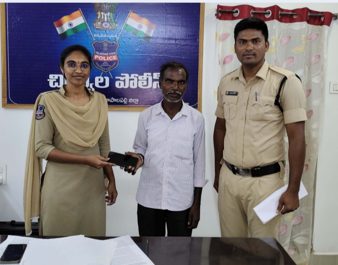
చిట్టాల ( ప్రజా జ్యోతి ) అక్టోబర్ 6 :