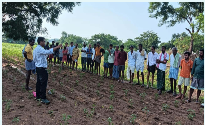
మరిపెడ, అక్టోబర్ 06 (ప్రజా జ్యోతి) :