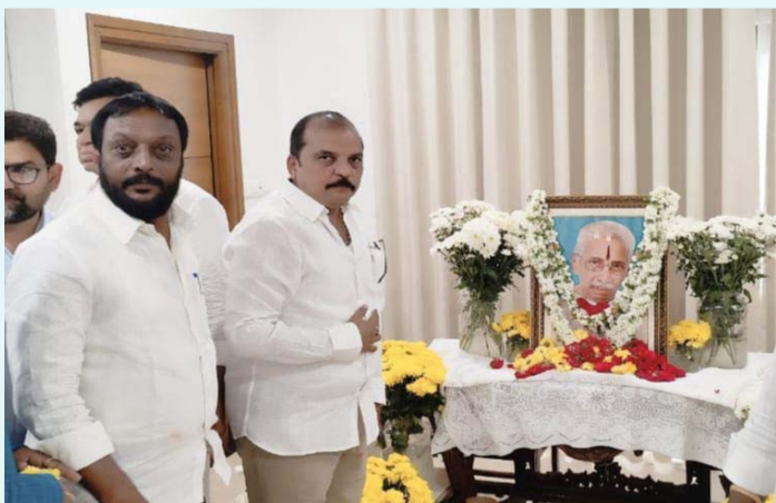
హనుమకొండ జిల్లా ప్రతినిధి: అక్టోబర్ 06, ప్రజా జ్యోతి.