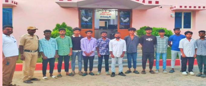
పరకాల, అక్టోబర్ 27, ప్రజా జ్యోతి.