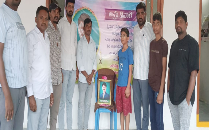
పర్వతగిరి, అక్టోబర్ 27 (ప్రజాజ్యోతి)