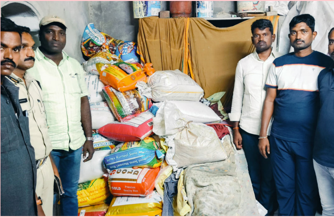
హనుమకొండ జిల్లా ప్రతినిధి: అక్టోబర్ 27, ప్రజా జ్యోతి.