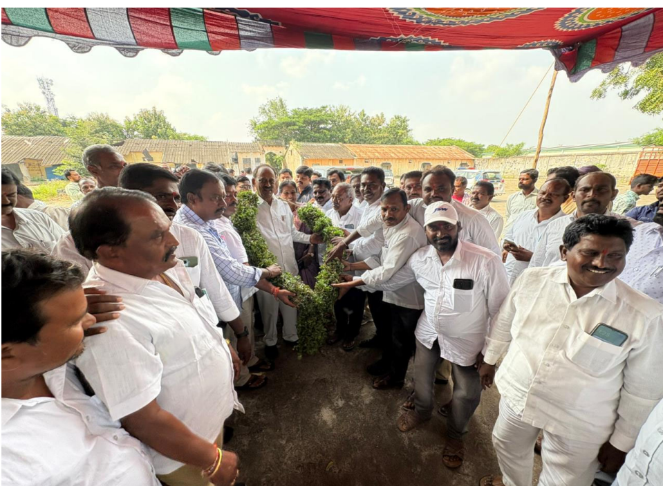
ప్రభుత్వ కొనుగోలు కేంద్రాలలో మాత్రమే సన్నధాన్యానికి బోనస్ లభిస్తుందన్నారు.

ఆదివారం ప్రాథమిక వ్యవసాయ సహకార సంఘం లి పరకాల వారి ఆధ్వర్యంలో ఏర్పాటు చేసిన వరి ధాన్యం కొనుగోలు కేంద్రాన్ని పరకాల వ్యవసాయ మార్కెట్ ప్రాంగణంలో పరకాల శాసనసభ్యులు రేవూరి ప్రకాశ్ రెడ్డి ప్రారంభించారు. ఈ సందర్భంగా ఎమ్మెల్యే మాట్లాడుతూ రైతులు పండించిన ధాన్యాన్ని కొనుగోలు కేంద్రాల్లోనే విక్రయించాలని రైతులు పండించిన ప్రతీ ధాన్యం గింజను ప్రభుత్వమే కొనుగోలు చేస్తుందన్నారు. ఏ గ్రేడ్ కు రూ. 2320, కామన్ రకానికి రూ.2300 ధర చెల్లిస్తుందని, రైతులు దళారులను ఆశ్రయించి మోసపోవద్దని సూచించారు. సన్న రకం ధాన్యానికి రూ.500 బోనస్ అందిస్తున్నట్లు ప్రభుత్వం నిర్ణయించిన ప్రకారం 17% మాయుచర్ ఉండాలి అని అన్నారు. కేవలం