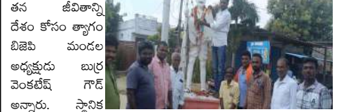
చిట్టాల (ప్రజా జ్యోతి) సెప్టెంబర్ 2,