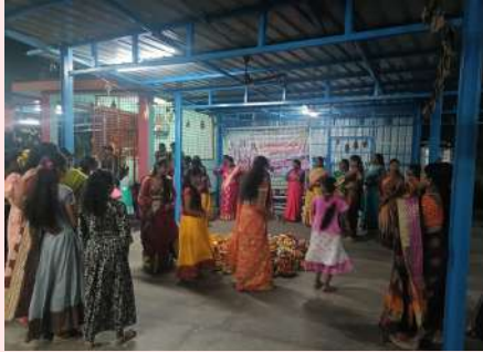
గంగారం అక్టోబర్ 2 (ప్రజా జ్యోతి)

గంగారం మండల కేంద్రంలోని కోమట్లగూడెం కోదండ రామాలయంలో ఎంగిలిపూల బతుకమ్మ ఘనంగా బుధవారం నాడు నిర్వహించారు ప్రతి గ్రామ గ్రామాన ఆడపడుచులు పూలను పూజించే ప్రకృతిని దేవతగా ఆరాధించే మన సంస్కృతి, సాంప్రదాయ పండుగ బతుకమ్మ ఆడపడుచులు తీర్చా పూలతో కన్నుల పండుగగా చేసుకొనే గొప్ప పండగ మన బతుకమ్మ తెలంగాణ సంస్కృతి సాంప్రదాయాలకు ఆడపడుచుల జ్ఞానాన్ని ప్రతీక అయిన బతుకమ్మ పండుగను ఆడపడుచులందరూ సంతోషంగా జరుపుకునే పండుగ ఆకాంక్షిస్తున్నా. పూలను పూజించి, ప్రకృతిని ప్రేమించే గొప్ప పండుగ బతుకమ్మ. పండుగ ఎంగిలిపూల బతుకమ్మతో మొదలై తొమ్మిది రోజుల పాటు తీర్చా పూలతో ఆడపడుచులందరూ జరుపుకుంటారు