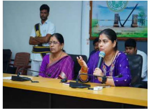
అంగన్ వాడీలు, ఆశ కార్యకర్తలు, పంచాయతీ సెక్రటరీల పాత్ర చాలా కీలకం అని జిల్లా కలెక్టర్ అన్నారు. ఈ కార్యక్రమంలో సంబంధిత శాఖల అధికారులు పాల్గొన్నారు.