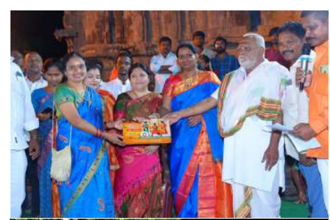
-కడియం కావ్య ఎంపీ