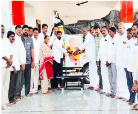
-పాల్గొన్న మాజీ ఎమ్మెల్యే మొలుగురి.