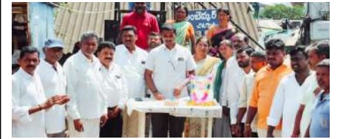
చిట్టాల (ప్రజా జ్యోతి) అక్టోబర్ 2,