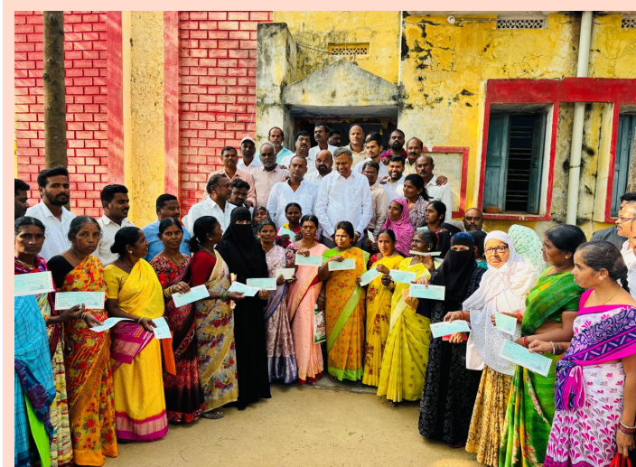
-జనగామ ఎమ్మెల్యే పల్ల రాజేశ్వర్ రెడ్డి