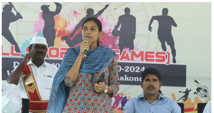
-క్రీడల్లో రాణిస్తే మంచి భవిష్యత్తు.