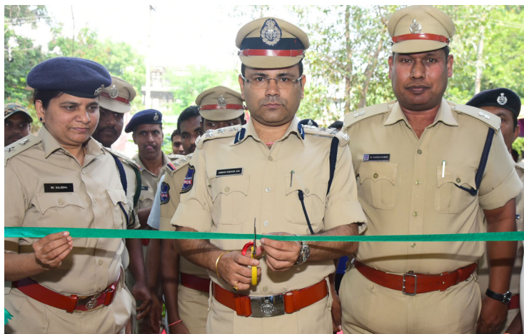
-పోలీసులు ప్రజల శ్రేయోభిలాషులు..