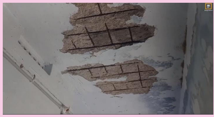
హనుమకొండ జిల్లా కమలాపూర్ అక్టోబర్ 25, (ప్రజాజ్యోతి) :

హనుమకొండ జిల్లా కమలాపూర్ మండల పరిధిలోని ఉప్పల్ గ్రామంలో ఎస్సీ బాలికల వసతిగృహం శిథిలావస్థకు చేరిందని దాదాపు 50 ఏళ్ల క్రితం నిర్మించిన భవనం కావడం వల్ల చిన్నచిన్న వర్షాలకే గోడల నుండి నీళ్లు కారుతున్నాయి.అలాగే భవనం పై పెచ్చులు ఊడిపడి ఎప్పుడు పడిపోతాయో తెలియని దుస్థితి ఉందని. బాత్రూములకు డోర్లు లేకపోవడంతో ఆడపిల్లలు తీవ్ర ఇబ్బందులు ఎదుర్కొంటున్నారని. ప్రస్తుతం ఈ భవనం ప్రమాదకరంగా ఉండడం వల్ల ఎప్పుడు ఏం జరుగుతుందో తెలియని పరిస్థితి ఉంది కాబట్టి ప్రస్తుతం ఉన్న అధికారులైన విద్యార్థుల సంక్షేమం కోసం విద్యార్థుల అవసరాల దృష్ట్య వెంటనే విద్యార్థులకు నూతన ఎస్సీ బాలికల వసతిగృహం నిర్మించాలని వారు డిమాండ్ చేశారు..