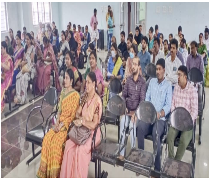
సూపర్వైజర్స్ మరియు సిబ్బంది పాల్గొన్నారు.