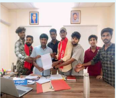
పరకాల, అక్టోబర్ 01, ప్రజా జ్యోతి.