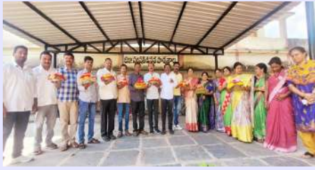
మరిపెడ, అక్టోబర్ 01 (ప్రజా జ్యోతి) :