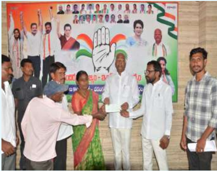
హనుమకొండ జిల్లా ప్రతినిధి: అక్టోబర్ 01, ప్రజా జ్యోతి.

స్టేషన్ ఘనపూర్ నియోజకవర్గ పరిధిలోని ఐనవోలు మండలం వెంకటాపూర్, గర్విజ్జపల్లి గ్రామాలకు చెందిన 5గురు కల్యాణ లక్ష్మి లబ్ధిదారులకు 5లక్షల 580రూపాయల విలువగల చెక్కులను, అలాగే ఇద్దరు ముఖ్యమంత్రి సహాయ నిధి లబ్ధిదారులకు 27వేల రూపాయల విలువగల చెక్కులను మాజీ ఉప ముఖ్యమంత్రి, స్టేషన్ ఘనపూర్ ఎమ్మెల్యే కడియం శ్రీహరి హనుమకొండ కనకదుర్గ కాలనీలోని ఎమ్మెల్యే నివాసంలో లబ్ధిదారులకు అందజేశారు. ఈ సందర్భంగా ఎమ్మెల్యే మాట్లాడుతూ... రాష్ట్ర ప్రభుత్వం అమలు చేస్తున్న సంక్షేమ పథకాలు పేద ప్రజలకు ఎంతో ఆసరాగా నిలుస్తున్నాయని అన్నారు. పేదల సంక్షేమానికి ప్రభుత్వం అనేక సంక్షేమ కార్యక్రమాలు అమలు చేస్తుందని పేర్కొన్నారు. కల్యాణ లక్ష్మి పథకం ద్వారా ఆదాపిల్లల తల్లిదండ్రులకు ఆర్థిక భారం తగ్గిందని తెలిపారు. అర్హులైన ప్రతీ ఒక్కరికి ప్రభుత్వ సంక్షేమ పథకాలు అందే విధంగా చూస్తానని వెల్లడించారు. ఈ కార్యక్రమంలో స్థానిక ప్రజా ప్రతినిధులు, మండల నాయకులు, కార్యకర్తలు తదితరులు పాల్గొన్నారు.