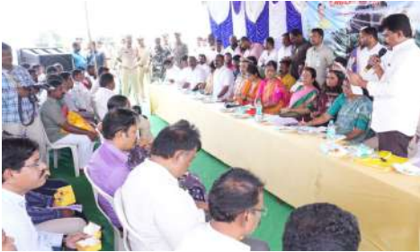
- రాష్ట్ర అటవీ పర్యావరణ దేవదాయ