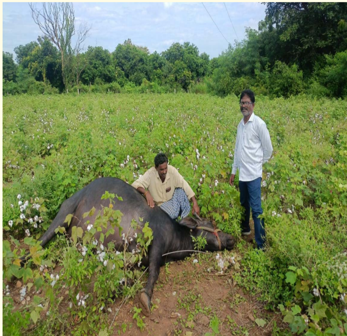
మరిపెడ, అక్టోబర్ 16 (ప్రజాజ్యోతి)