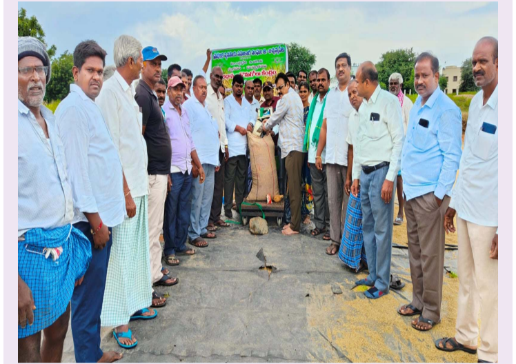
అక్టోబర్ 14 (ప్రజాజ్యోతి) :

-దాన్యం కొనుగోలుకేంద్రాలను రైతులు సద్వినియోగం చేసుకోవాలి -సహకార సంఘం జిల్లా అధికారి రాజేందర్ రెడ్డి