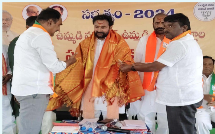
వరంగల్ సిటీ, అక్టోబర్ 14 (ప్రజాజ్యోతి):