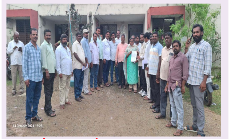
మరిపెడ,అక్టోబర్14 (ప్రజా జ్యోతి) :