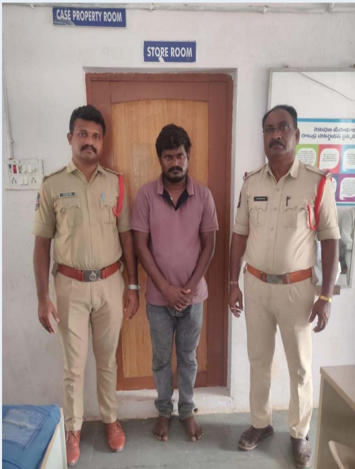
దేవరవుల అక్టోబర్ 14, (ప్రజాజ్యోతి):-