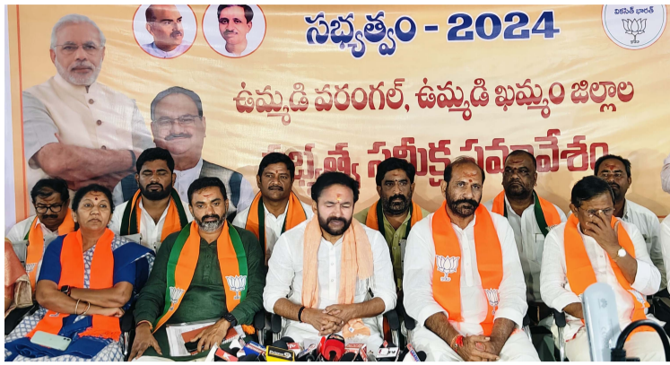
- బిజెపి రాష్ట్ర అధ్యక్షుడు, కేంద్ర మంత్రి జి కిషన్ రెడ్డి వరంగల్ సీటీ, అక్టోబర్ 14 (ప్రజాజ్యోతి) :