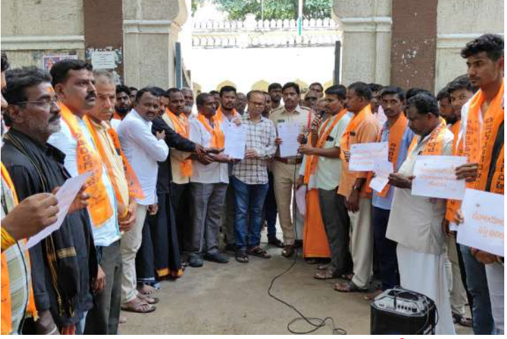
-నిందితులను కఠినంగా శిక్షించాలని డిమాండ్ చేసిన భజరంగ్ దళ్, విశ్వహిందూ పరిషత్

మఖ్టల్ నియోజకవర్గ ప్రతినిధి, అక్టోబర్ 19 (ప్రజా జ్యోతి): భాగ్యనగరంలో తరచూ హిందూ దేవాలయాలపై దాడులు జరుగుతున్న ప్రభుత్వంలో ఎలాంటి చలనం లేదని హిందువుల మనోభావాలకు విఘాతం కలిగిస్తే ఇక ఊరుకునేది లేదని భజరంగ్ దళ్, విశ్వహిందూ పరిషత్ డిమాండ్ చేశాయి. శనివారం నారాయణపేట జిల్లా మఖ్టల్ పట్టణ కేంద్రంలోని స్వామి వివేకానంద చౌరస్తాలో భజరంగ్ దళ్, విశ్వహిందూ పరిషత్ ఆధ్వర్యంలో భాగ్యనగరంలోని సికింద్రాబాద్ లో గల ముత్యాలమ్మ దేవాలయంలోకి చొరబడి అమ్మవారి విగ్రహాన్ని ధ్వంసం చేసిన దుండగులను కఠినంగా శిక్షించాలని డిమాండ్ చేస్తూ భజరంగ్ దళ్, విశ్వహిందూ పరిషత్ సభ్యులు 167 జాతీయ రహదారిపై ఆందోళనకు దిగి నిరసన చేపట్టారు. హిందూ దేవాలయాలపై దాడికి పాల్పడ్డా వ్యక్తులను మత్స్యమితం లేని వ్యక్తులుగా చిత్రీకరించడం తగదని, విగ్రహాలను ధ్వంసం చేయడంతో పాటు రోజురోజుకు హిందువులపై దాడులకు పాల్పడుతున్న మతోన్మాదులపై తక్షణమే ప్రభుత్వం చర్యలు తీసుకోవాలని, రాష్ట్రంలో హిందూ దేవాలయాలపై, హిందువులపై దాడులు జరుగుతుంటే రాజకీయ ప్రముఖులు మాత్రం వాళ్లు హిందువులు కానట్లు తమ తమ పార్టీలను పట్టుకొని వేలాడటం సిగ్గుచేటని విశ్వహిందూ