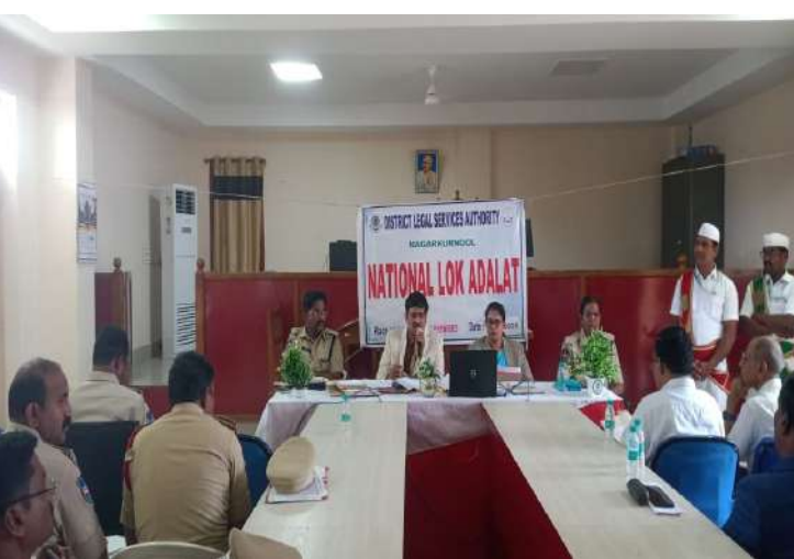
-జిల్లా ప్రధాన న్యాయమూర్తి డి రాజేష్ బాబు

నాగర్ కర్నూల్ అక్టోబర్ 19 (ప్రజాజ్యోతి ప్రతినిధి )