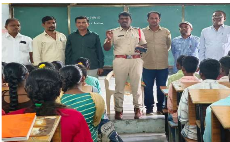
మల్లెల్ నియోజకవర్గ ప్రతినిధి, అక్టోబర్ 19 (ప్రజా జ్యోతి):