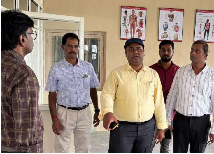
-హాజరుకాసున్న మంత్రులు దామోదర్ రాజనర్సింహ, కొండా సురేఖ