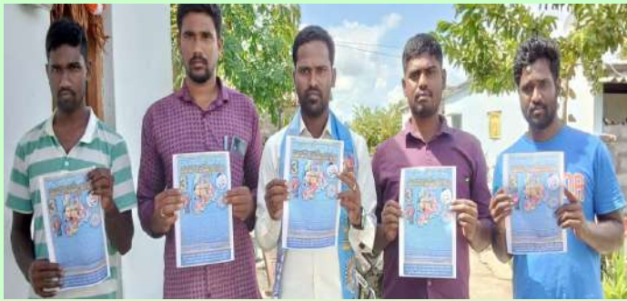
తొగుట అక్టోబర్ 19( ప్రజా జ్యోతి)

-కాసర్ల యాదగిరి ధర్మ సమాజ్ పార్టీ జిల్లా ప్రధాన కార్యదర్శి