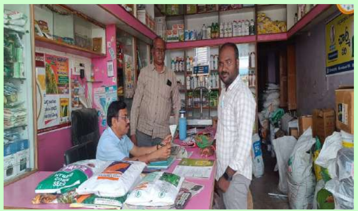
రాయపోల్, అక్టోబర్ 19 ప్రజా జ్యోతి

దౌలాబాద్ మండల కేంద్రంలోని వ్యవసాయ శాఖ ఏడీవీ మల్లయ్య ఫర్టిలైజర్ షాపులను తనిఖీ చేసి నాసిరకం విత్తనాలు, పురుగు మందులు, ఎరువులు రైతులకు విక్రయిస్తే పర్మిట్టెజర్ షాపులపై కఠిన చర్యలు తీసుకుంటామని దుబ్బాక వ్యవసాయ శాఖ ఏడీవీ మల్లయ్య హెచ్చరించారు. శనివారం వ్యవసాయ శాఖ ఏ డి ఏ మల్లయ్య దౌలాబాద్ మండల కేంద్రంలోని పలు పర్మిట్టెజర్ షాపులను తనిఖీ చేశారు. షాపులో రికార్డులను పరిశీలించారు. రైతులు కోసుగోలు చేస్తున్న ప్రతి దానికి ఖచ్చితంగా రశీదులు ఇవ్వాలని ఆయన ఆదేశించారు. రైతులు కుడా విత్తనాలు, ఎరువులు కోసుగోలు చేస్తే సంబంధిత షాపు యాజమాని వద్ద రశీదులు పొందాలని పేర్కొన్నారు. షాపు యాజమానులు రైతులకు విధిగా బిల్లు, రశీదులు ఖచ్చితంగా ఇవ్వాలని ఆయన స్పష్టం చేశారు. రైతులకు ఇబ్బందులు లేకుండా నాణ్యమైన ఎరువులు, విత్తనాలు, పురుగు మందులను అందించాలని ఆయన పేర్కొన్నారు. రైతులు కుడా ఎరువులు, విత్తనాలతో పాటు పురుగు మందులు కోసుగోలు చేసే సమయంలో డిలర్ల వద్ద నుంచి రశీదులు చేసుకోవాలని ఆయన పేర్కొన్నారు.