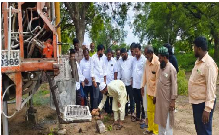
మరియు తదితరులు పాల్గొన్నారు.