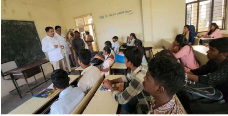
-ఎమ్మెల్యే కసిరెడ్డి నారాయణరెడ్డి -కళాశాలను ఆకస్మికంగా తనిఖీ చేసిన ఎమ్మెల్యే - కళాశాల ప్రిన్సిపాల్ పై ఎమ్మెల్యే ఆగ్రహం