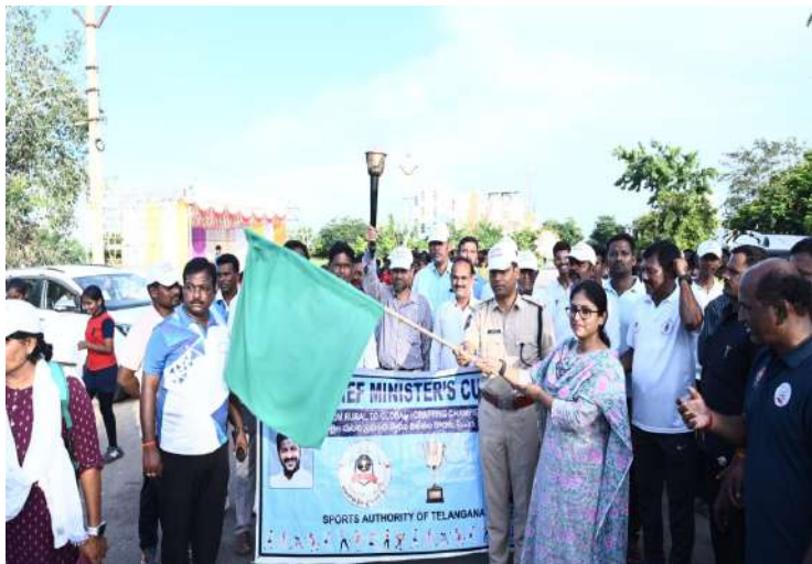
-ర్యాలీని ప్రారంభించిన జిల్లా కలెక్టర్, ఎస్పీ

నారాయణపేట జిల్లా ప్రతినిధి ప్రజాజ్యోతి అక్టోబర్ 19: