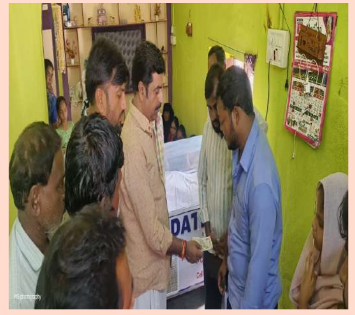
(ప్రజా జ్యోతి అక్టోబర్ 19/ తల కొండపల్లి)