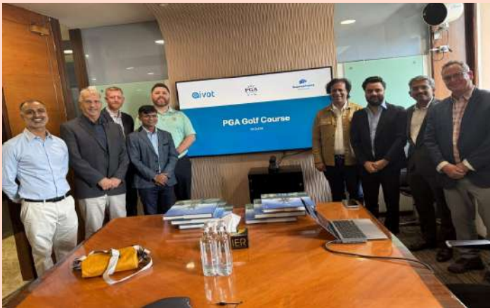
ముషీరాబాద్, అక్టోబర్ 19 (ప్రజా జ్యోతి) :