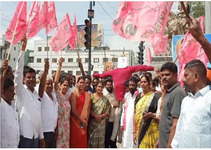
-ఎద్దు ఏడ్చినా ఏవుసం, రైతు ఏడ్చినా రాజ్యం బాగుపడదు