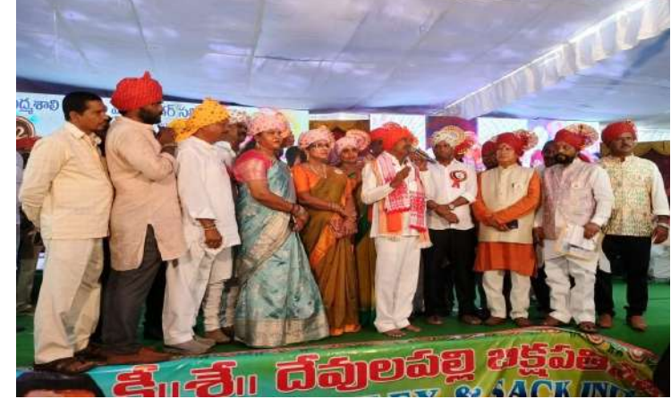
పొందినప్పుడే రాజ్యాంగం ప్రకారం మనకు రావలసిన హక్కులు అన్ని పొందుతాము స్థానిక సంస్థల్లో కూడా పోటీ చేసి సత్తా చాటాలి బీసీ కులగణన చేయడానికి రాష్ట్ర ప్రభుత్వం అనుకూలంగా ఉంది అని వాపోయారు కార్యక్రమ నిర్వహణకు వచ్చేసిన వారందరికీ ప్రత్యేక కృతజ్ఞతలు తెలిపారు