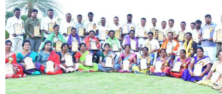
ఘనంగా సన్మానించారు. ఈ కార్యక్రమంలో చన్నెల్లి పామేన బస్సేపూర్ గ్రామాల పూర్వ విద్యార్థులు పాల్గొన్నారు.