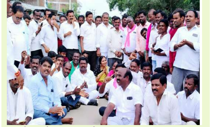
పాపన్నపేట, అక్టోబర్ 20 (ప్రజాజ్యోతి):

-మెదక్ మాజీ ఎమ్మెల్యే పద్మదేవేందర్ రెడ్డి