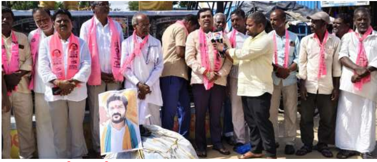
-రైతు భరోసా కోసం రైతుల పక్షాన బిఆర్ఎస్ నిరసన కార్యక్రమం...