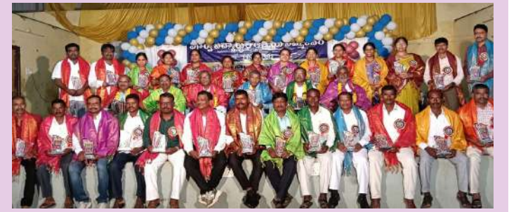
అబ్దుల్లాపూర్ మెట్ అక్టోబర్ 20 (ప్రజా జ్యోతి)