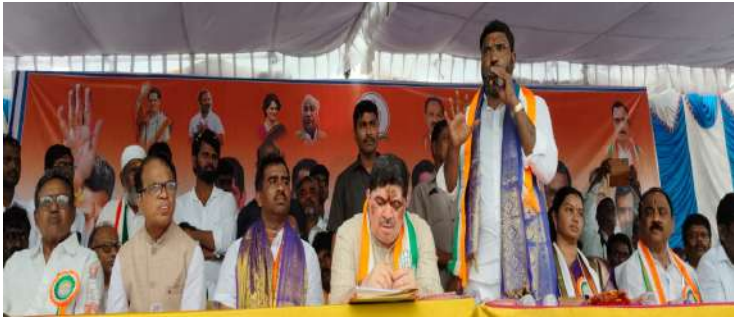
-ప్రమాణ స్వీకారానికి వచ్చిన మంత్రి పొన్నం ప్రభాకర్