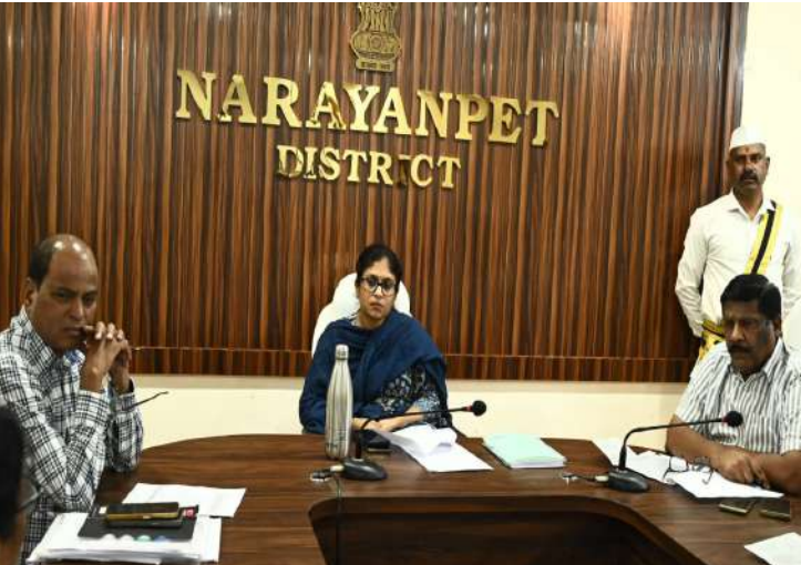
నారాయణపేట జిల్లా ప్రతినిధి ప్రజా జ్యోతి అక్టోబర్ 18: