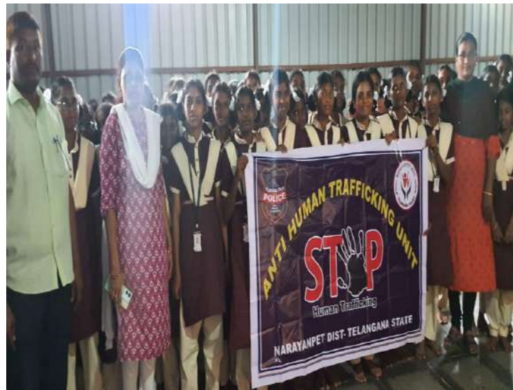
మల్లెల్ నియోజకవర్గ ప్రతినిధి, అక్టోబర్ 18 (ప్రజా జ్యోతి):