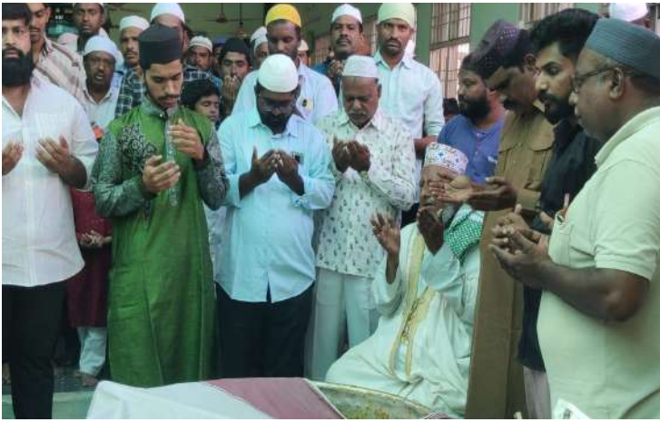
హుస్సాబాద్, అక్టోబర్ 18 (ప్రజా జ్యోతి):