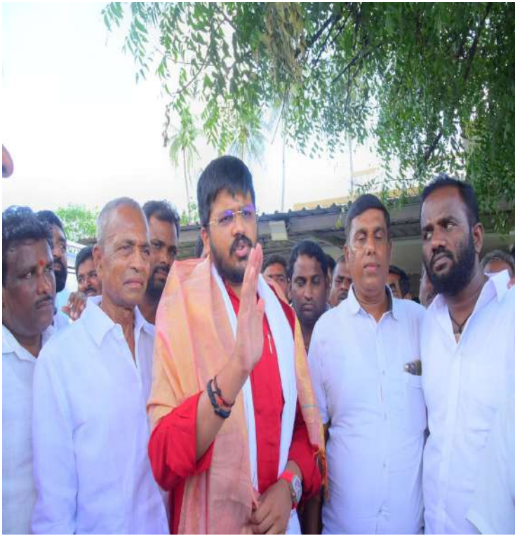
- మెదక్ జిల్లాలో త్వరలోనే ఇంటిగ్రేటెడ్ రెసిడెన్షియల్ పాఠశాలలు

- ప్రభుత్వ నిధులు, ఎంఎస్ఎస్ఎస్ నిధులతో ప్రత్యేక అభివృద్ధికి త్వరలోనే శ్రీకారం