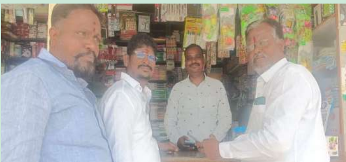
సిద్దిపేట టౌన్ ప్రజాజ్యోతి :