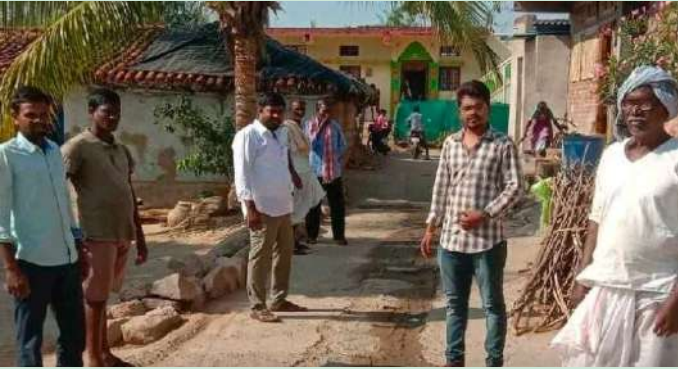
కల్వేర్ 18 అక్టోబర్ ప్రజా జ్యోతి.