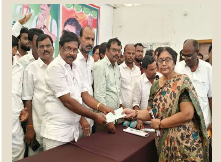
అచ్చంపేట అక్టోబర్ 18 (ప్రజా జ్యోతి) :

-అచ్చంపేట ఎమ్మెల్యే డాక్టర్ చిక్కూడు వంశీకృష్ణ