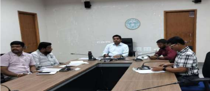
- 10వ తరగతి ఉత్తీర్ణత సాధించిన విద్యార్థులు సద్వినియోగం చేసుకోవాలి