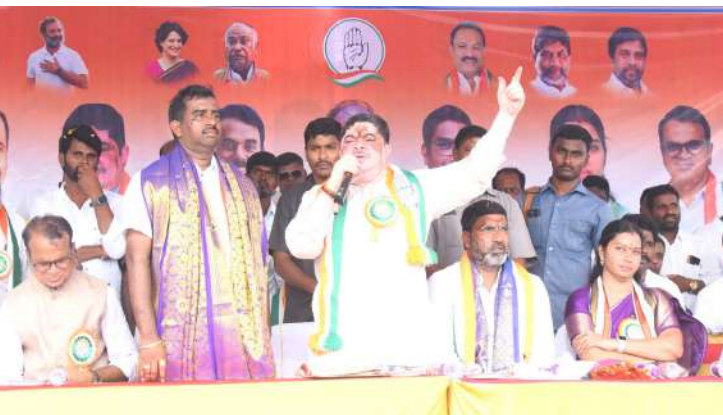
గద్వాల అక్టోబర్ 18(ప్రజా జ్యోతి ప్రతినిధి):