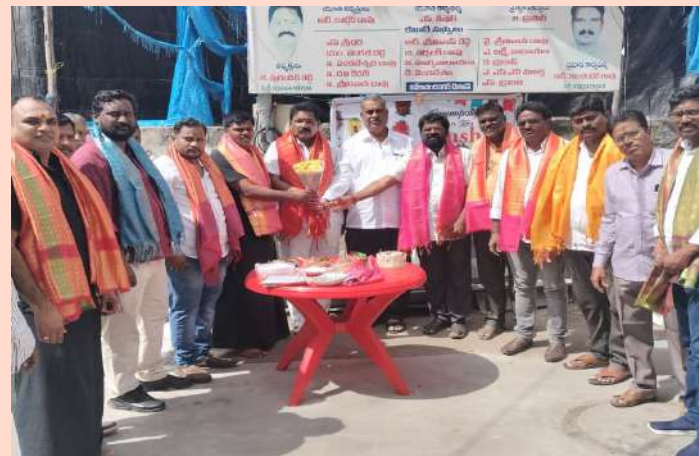
కూకట్ పల్లి, అక్టోబర్ 18 (ప్రజా జ్యోతి) :