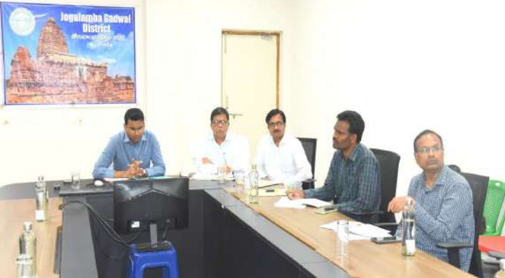
గద్వాల అక్టోబర్ 18 (ప్రజాజ్యోతి ప్రతినిధి):

తెలంగాణ రాష్ట్ర పబ్లిక్ సర్వీస్ కమిషన్ నిర్వహిస్తున్న గ్రూప్ -3 రాత పరీక్షలకు విధులు నిర్వహిస్తున్న సంబంధిత అధికారులు అందరూ సమన్వయంతో పని చేసి పరీక్షలు ప్రశాంతంగా, సజావుగా జరిగేలా చర్యలు తీసుకోవడం జరుగుతుందని జిల్లా కలెక్టర్ బి.ఎం.సంతోష్ అన్నారు. శుక్రవారం తెలంగాణ రాష్ట్ర పబ్లిక్ సర్వీస్ కమిషన్ చైర్మన్ మహేందర్ రెడ్డి తన కార్యాలయం నుండి జిల్లా కలెక్టర్లు, పోలీసు అధికారులతో గ్రూప్ 3 పరీక్షల ఏర్పాట్లపై వీడియో కాన్ఫరెన్స్