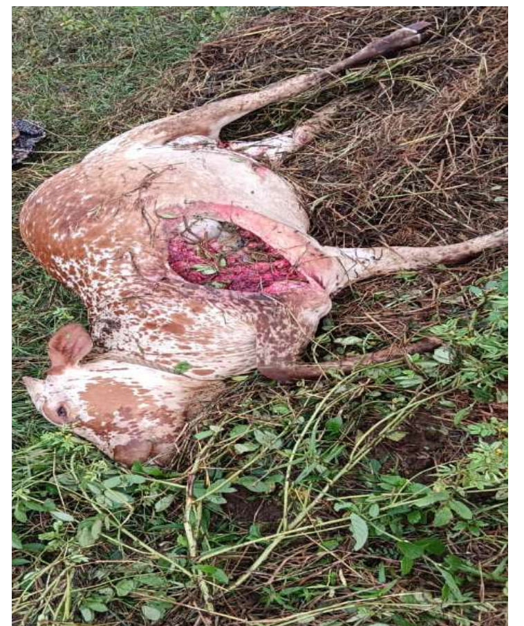
సంఘటనా స్థలానికి చేరుకుని పరిశీలించారు. డీఎఫ్ ఓ పొలంలో ఉన్న జంతువు పాద ముద్రలను పరిశీలించి చిరుతపులికి చెందినవిగా గుర్తించారు.

తాండూరు నియోజకవర్గంలో పులి సంచారం జరుగుతున్నట్లు నిర్ధారణ అయ్యింది. ఈ సంఘటన మండలంలో తీవ్ర కలకలం రేపింది. విషయం తెలుసుకున్న అటవీ శాఖ అధికారులు, యాలాల పోలీసులు