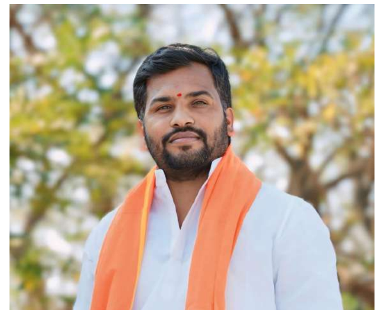
గ్రామపంచాయతీలలోని ప్రజలకు ప్రజావాణి పై అవగాహన తీసుకురావాలని తెలిపారు.