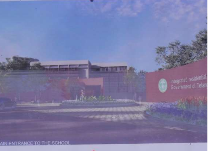
-రాష్ట్ర వైద్య ఆరోగ్యశాఖ మంత్రి -దామోదర్ రాజనర్సింహ -పుల్లారాజు మండలం బస్సాపూర్ లో రూ.125 కోట్లతో సమీకృత గురుకుల పాఠశాల నిర్మాణానికి శంకుస్థాపన సంగారెడ్డి, అక్టోబర్ 16, ప్రజా జ్యోతి స్టూన్ ప్రతినీధి :-