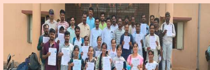
అల్లదుర్గం అక్టోబర్ 16 (ప్రజాజ్యోతి)