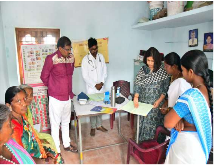
వైద్య సిబ్బంది, అధికారులు, పాల్గొన్నారు.