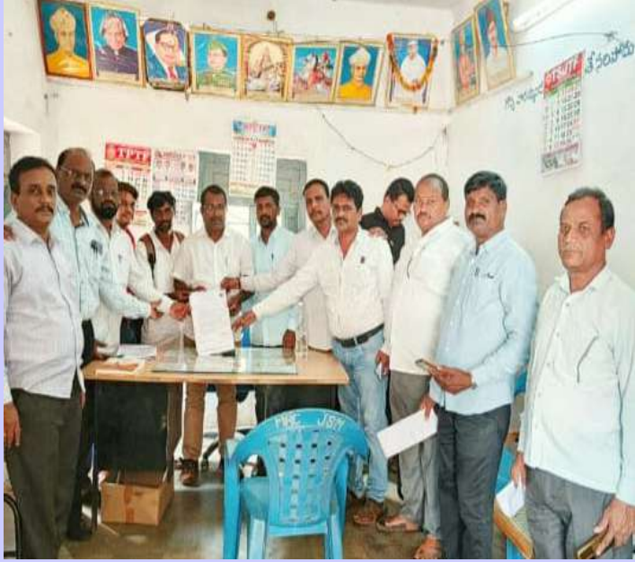
జహీరాబాద్, అక్టోబర్ 16 (ప్రజా జ్యోతి న్యూస్ )