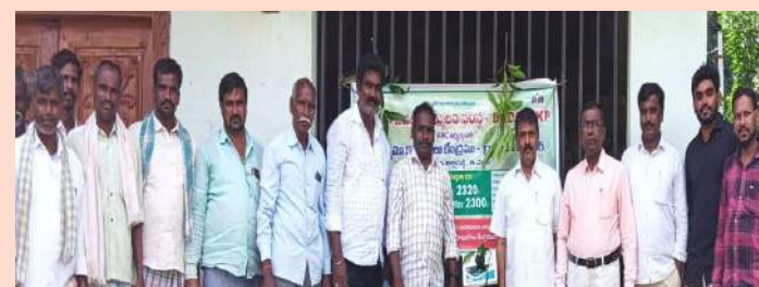
అల్లదుర్గం అక్టోబర్ 16