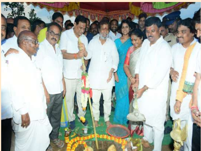
సిర్సాపూర్ అక్టోబర్ 16(ప్రజాజ్యోతి)