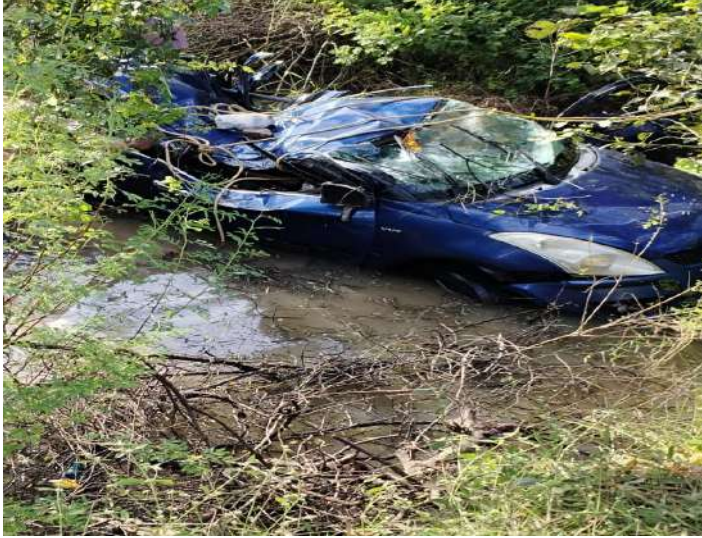
శివంపేట ప్రజాజ్యోతి అక్టోబర్ 16

-డ్రైవర్ నిర్లక్ష్యం అతివేగంతో అక్కడికక్కడ ఏడుగురు మృతి!!