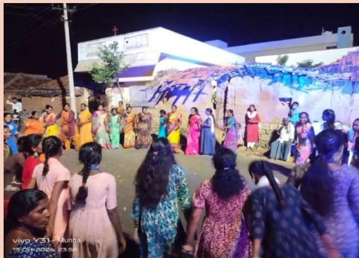
కోపాడ, అక్టోబర్ 14 (ప్రజా జ్యోతి)

కనకదుర్గమ్మ శోభాయాత్ర ఆదివారం కోపాడ మండలవ్యాప్తంగా.. జరిగింది. తంగళపల్లి గ్రామంలోని మహారాజ్ కాలనీలో ఘనంగా నిర్వహించారు. దుర్గాదేవి విగ్రహాన్ని ప్రత్యేకంగా అలంకరించిన వాహనంలో పెట్టి శోభాయాత్ర నిర్వహించగా, మహిళలు మంగళహారతులతో స్వాగతం పలికారు. భక్తులు, మహిళలు, చిన్నారులు బతుకమ్మ ఆట పాటలతో.. శోభాయాత్ర సాగించారు. అమ్మవారి దీవెనలతో.. గ్రామ ప్రజలు బాగుండాలని, పాడిపంటలు సమృద్ధిగా పండాలని, బాగుండాలని వేడుకొన్నారు.