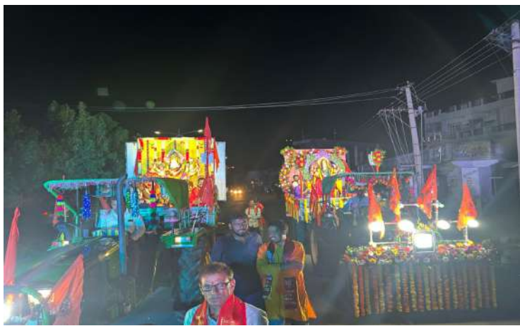
చేర్యాల ప్రజాజ్యోతి :

తొమ్మిది రోజుల పాటు విశేష పూజలందుకున్న దుర్గమ్మ నిమజ్జనాలు ఆదివారం చేర్యాల పట్టణ కేంద్రంలో ఘనంగా నిర్వహించారు. వైభవంగా అలంకరించిన వాహనాల్లో పురవీధులలో భాజా భజంత్రీల సమయం శోభాయాత్ర కన్నుల పండుగగా జరిగింది. శరన్నవరాత్రి ఉత్సవాల్లో భాగంగా చేర్యాల పట్టణంలోని వార్డుల్లో ప్రతిష్ఠించిన