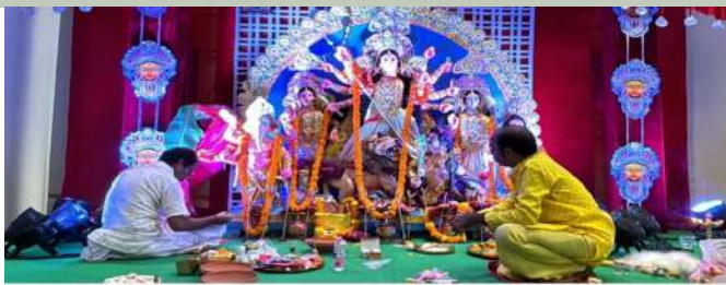
Maa Durga puja in progress at the Aparna Cyberscape, Nallagandla.