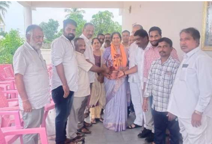
-అలయ్ బలయ్ లో మాజీ ఎమ్మెల్యే పద్మ దేవేందర్ రెడ్డి