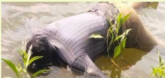
శివ్వంపేట ప్రజాజ్యోతి అక్టోబర్ 14