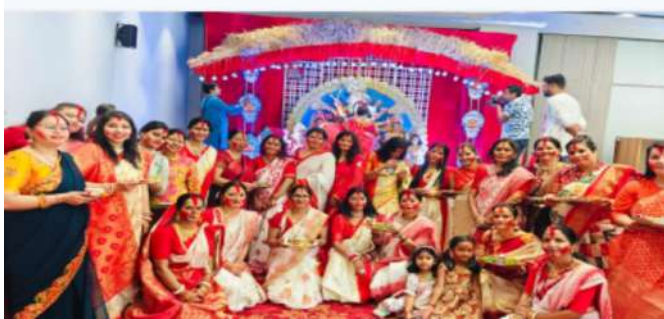
శ్రీలింగంపల్లి, అక్టోబర్ 14 (ప్రజాజ్యోతి):

అపర్ణ సైబర్ స్కేప్ ఇటీవల దుర్గాపూజ, బతుకమ్మ మరియు నవరాత్రుల యొక్క మొట్టమొదటి గొప్ప వేడుకలను నిర్వహించింది, ఇది సంఘం యొక్క సాంస్కృతిక క్యాలెండర్ లో ఒక ముఖ్యమైన మైలురాయిని సూచిస్తుంది. ఈ కార్యక్రమం విభిన్న సంప్రదాయాలను ఒకచోట చేర్చింది, భారతీయ పండుగల యొక్క గొప్ప వస్త్రాన్ని ప్రదర్శిస్తూ నివాసితుల మధ్య ఐక్యత మరియు చేరికను ప్రోత్సహిస్తుంది. దేవి దుర్గను లోతైన భక్తితో పూజించారు. విస్తృతమైన ఆచారాలలో అందంగా రూపొందించిన విగ్రహాల ప్రతిష్ఠాపన, పుష్పాలు, సాంప్రదాయ అలంకరణలతో అలంకరించబడి ఉంటుంది. నివాసితులు ప్రార్థనలు, కీర్తనలు, నైవేద్యాలలో పాల్గొన్నారు, వారి భక్తిని వ్యక్తం చేస్తూ, బలం మరియు శ్రేయస్సు కోసం ఆశీర్వాదాలు కోరుతున్నారు. వివాహిత స్త్రీలు ఒకరిపై ఒకరు సిందూరం (వెర్మిలియన్) పూసుకుంటారు, దేవత పట్ల వారి ప్రేమ మరియు గౌరవాన్ని సూచిస్తుంది అక్టోబర్ 13, 2024న నల్లగండ్ల సరస్సులో జరిగిన అపర్ణ సైబర్ స్కేప్ కోసం దేవి దుర్గ యొక్క వినర్డ్స్ ఆధ్యాత్మికత, సమాజ బంధాన్ని అందంగా విలీనం చేసే ఒక శక్తివంతమైన వేడుక. ఈ వార్షిక కార్యక్రమం దుర్గాపూజ యొక్క ముగింపును సూచిస్తుంది, ఇక్కడ భక్తులు ఒక వారం ఉత్సవాల తర్వాత అమ్మవారికి వీడ్కోలు పలికారు.