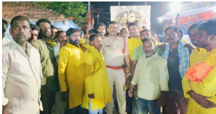
-ఉదయ్ యూత్. విలేజ్ సభ్యులు సహకరించారు ప్రజా జ్యోతి . అక్టోబర్ 14

నంగారెడ్డి జిల్లా పుల్లూర్ మండలంలోని పుల్లూర్ గ్రామంలో నవరాత్రిలు పూజలు అందుకున్న అమ్మవారు అనునిత్యం అమ్మవారి సేవలో ఉంటూ తొమ్మిది రోజులు అమ్మవారు తొమ్మిది అవతారాల్లో భక్తులకు ఆశీర్వాదాలు ఇచ్చి తొమ్మిదవ రోజు మహిషాసుర మర్ధిని అవతారంలో దర్శనము ఇచ్చింది. భక్తులు మా ఊరి పాడిపంటలు పశువులు ప్రజలను అందరినీ చల్లగా చూడాలని అమ్మవారిని వేడుకున్నారు. నవరాత్రిలో మహర్షమిగా పేర్కొనే తొమ్మిదవరోజు అమ్మవారు మహిషాసుర మర్ధినిగా అవతారం దాల్చుతుంది. మహిషుడిని సంహరించిన అమ్మ ఆపదల్లో మనకు అండగా ఉంటుంది. దుష్టశిక్షణ, శిష్ట రక్షణ చేసి లోకం సుఖ శాంతులతో విలసిల్లే విధంగా కటా పాడుతుంది. ఈరోజు అమ్మను సేవిం పడవల్ల మన ఆపదలు, భయాలు అన్నీ తొలగుతాయిసనాతని అయిన ఈ తల్లీ మహాకటా ఖి, త్రిపుర సుందరి, దుర్గ, గౌరి మొదలైన నామాలతో పిలువబడుతున్నది. సర్వాధిష్ఠాత్రి. శివరూపిణి. అన్నపూర్ణ, రాజరాజేశ్వరి. ధర్మం, సత్యం, పుణ్యం, యశస్సు, మంగళాలను ప్రసాదించేది. మోక్షదాయిని. ఆనంద ప్రదాయిని. శోకనాశిని. ఆర్దివినాశిని. తేజస్వరూపిణి. అమ్మవారి పరిపూర్ణ రూపాలలో పరిపూర్ణమైనది. ఈ తల్లి దుష్ట సంహారిణి. శిష్ట సంరక్షణి. మహిషాసుర, చందముండాది రాక్షసులను సంహరించిన వీరమూర్తి. కరుణ కురిపించి కటా పాడే సౌజన్యమూర్తి. కటా రుణ్యమూర్తి. రాక్షసులు దేహమే తామనుకుంటూ దేహాన్ని రక్షించుకునే ప్రయత్నంలో ఉండేవారు. అందరి దగ్గర శక్తిని గ్రహించేవారు.