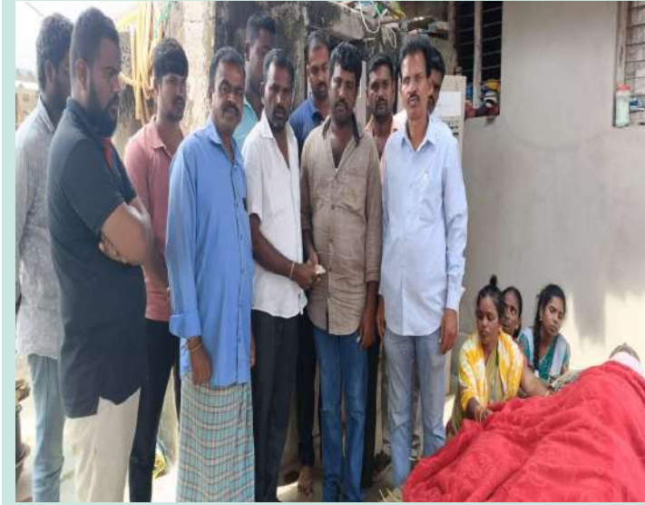
తొగుట అక్టోబర్ 14 (ప్రజా జ్యోతి)

-కాంగ్రెస్ పార్టీ సీనియర్ నాయకులు పంది రాజు