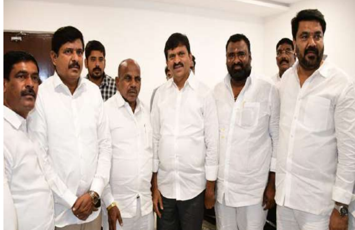
చేవెళ్ల అక్టోబర్ 14(ప్రజా జ్యోతి):