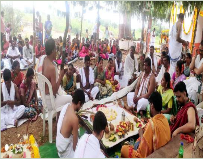
పాపన్నపేట, అక్టోబర్ 14 (ప్రజాజ్యోతి):