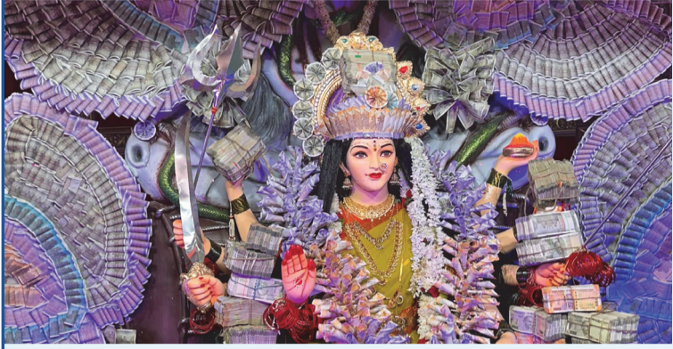
ప్రజాజ్యోతి నిజామాబాద్ ప్రతినిధి: