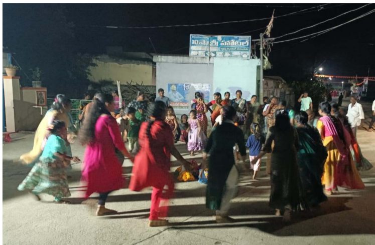
పూల వేడుకలో ఐదో రోజు అట్ల బతుకమ్మ .

పాలేరు అక్టోబర్ 6 ప్రజా జ్యోతి : ఖమ్మం జిల్లా పాలేరు నియోజకవర్గంలోని పలు మండలంలోని పలు గ్రామాలలో ఘనంగా బతుకమ్మ వేడుకలు జరిగాయి బతుకమ్మ వేడుకలలో తొమ్మిది రోజులు రకరకాలుగా గౌరవము కొలుచుకునే ఆడబిడ్డలు ఒక్కో రోజు ఒక్కో రకమైన ప్రసాదాన్ని తయారు చేసి గౌరవముకు నైవేద్యంగా సమర్పిస్తారు. పసుపు, కుంకుమలతో సౌభాగ్యవతులుగా జీవించాలని కోరుకుంటారు. తమ ఇల్లు పాడి పంటలతో వర్ధిల్లాలని గౌరవము వేడుకుంటారు. బతుకమ్మ బతుకు అమ్మా అని ఆడబిడ్డలను దీవించే పండుగ. తెలంగాణ సాంస్కృతిక వైభవాల పండుగ బతుకమ్మ. ఈ బతుకమ్మ పండుగ వెనుక ఎన్ని కథలు ఉన్నా ఈ పండుగలో ప్రధానమైన పాత్రను వహించేవి పూలే. పువ్వుల సంబురాల పండుగలో అప్పుడే నాలుగు రోజులు పూర్తయ్యాయి. ఈరోజు ఐదో రోజు. బతుకమ్మ పండుగలో అట్ల బతుకమ్మ పండుగ. మానవ జీవితానికి ప్రకృతితో పెనవేసుకున్న బంధమైన ఈ బతుకమ్మ పండుగలో ఎన్నో రకాల పూలు మమేకమైపోతాయి. వాటి వాటి పుట్టుకను సార్వకం చేసుకుంటాయి. తెలంగాణలో జరుపుకునే ఈ పండుగ రాష్ట్ర వ్యాప్తంగానేకాదు ప్రపంచంలో ఎక్కడ తెలంగాణ ఆడబిడ్డలు ఉన్నా ఈ పండుగను