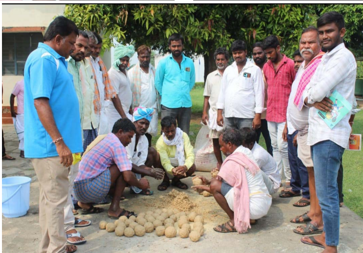
పెంపకంలో వాడే వివిధ రసాయన పదార్థాల లాభనష్టాల గురించి మత్స్య రైతులకు సంక్షిప్తంగా వివరించారు కావున మన మత్స్య రైతులు