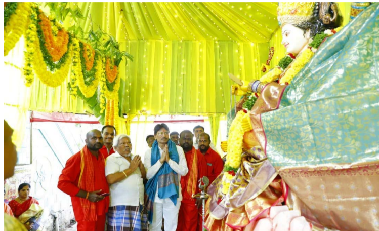
దేవీ నవరాత్రి ఉత్సవాలు ఘనంగా ఆరంభమయ్యాయి.