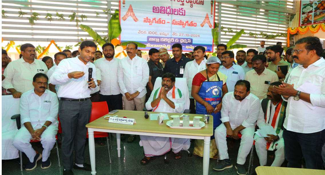
నిర్ణయాలు తీసుకున్నదని అన్నారు. మహిళలను మహాలక్ష్మి గా కొలుస్తామని, స్త్రీలను గౌరవించుకునే విధంగా ప్రభుత్వం అధికారంలోకి రాగానే 48 గంటల్లో ఆర్డీసీ బస్సులలో ఉచిత ప్రయాణ సౌకర్యం కల్పించామని, టికెట్ ఖర్చులను ప్రభుత్వమే ఆర్డీసీకి చెల్లిస్తుందని

చర్యలు.....రాష్ట్ర ఉప ముఖ్యమంత్రి, భట్టి విక్రమార్క మల్లు 5 సంవత్సరాలలో మహిళా సంఘాలకు లక్ష కోట్ల వడ్డీ లేని రుణాలు ప్రతి అసెంబ్లీ సెషన్లలో మహిళలకు ప్రత్యేకంగా ఎం.ఎస్.ఎం.ఈ. పార్కుల ఏర్పాటు ఆర్థిక సంస్థకు అద్దె బస్సులను మహిళా సంఘాల ద్వారా సరఫరా చేసేందుకు ప్రణాళిక మహిళాభివృద్ధిలో దేశానికి ఆదర్శంగా నిలువనున్న తెలంగాణ మహిళల ఉచిత ఆర్డీసీ ప్రయాణానికి రూ. 400 కోట్లు చెల్లిస్తున్న ప్రజా ప్రభుత్వం సమీకృత జిల్లా కలెక్టరేట్ బస్ స్టాప్ షెల్టర్, స్త్రీ టీ స్టాల్, లేడీస్ లాంజ్, ఉద్యోగుల భోజనశాల, ఇందిరా మహిళా శక్తి క్యాంపీన్ లను ప్రారంభించిన డిప్యూటీ సీఎం