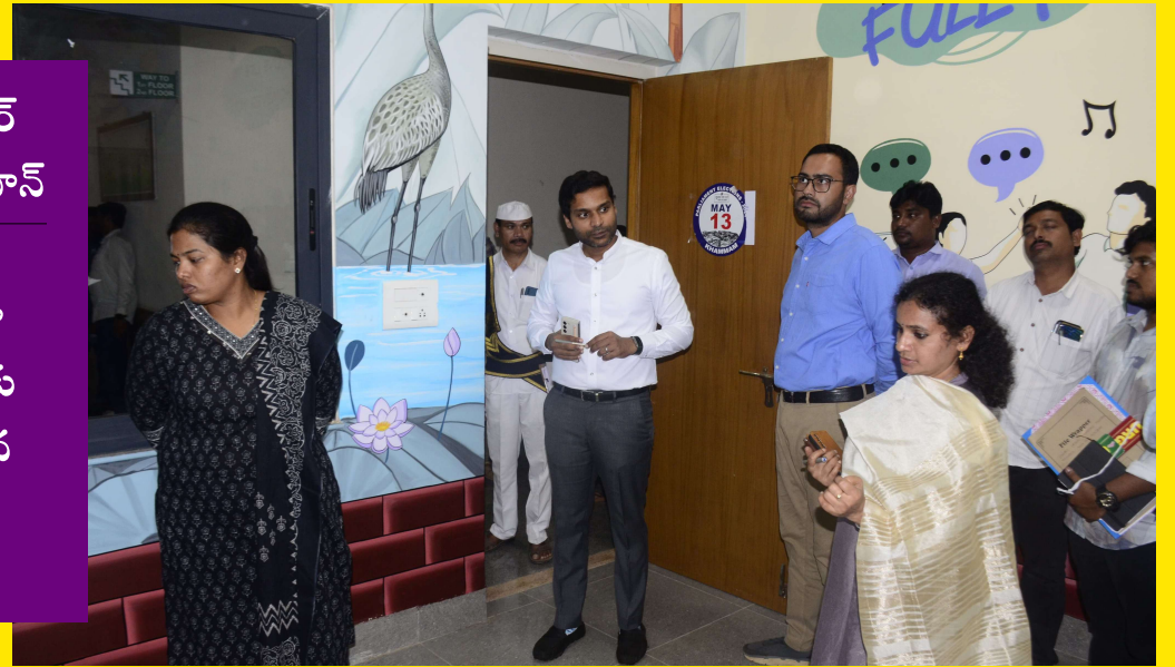
ఖమ్మం ప్రతినిధి ప్రజా జ్యోతి

జిల్లా కలెక్టర్ ముజమ్మిల్ ఖాన్ పిల్లలు అప్రోదంగా గడిపేందుకు అవసరమైన ఏర్పాట్లు