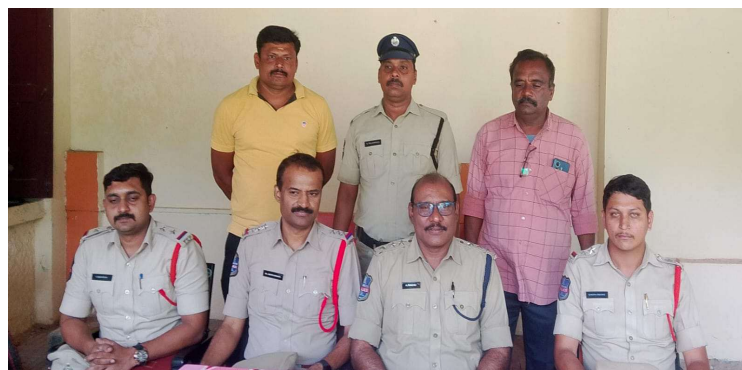
సత్తుపల్లి అక్టోబర్ 23 ప్రజా జ్యోతి.

తెలంగాణ, ఆంధ్ర రాష్ట్రాలలో వరుసగా పలు దేవాలయాలలో చోరీలకు పాల్పడుతూ, వేంసూరు మండలం కందుకూరు గ్రామంలో శ్రీ వెంకటేశ్వర స్వామి దేవస్థానంలో దొంగతనానికి ప్రయత్నిస్తుండగా అనుమానంతో స్థానికులు పోలీసులకు - మిగతా3లో