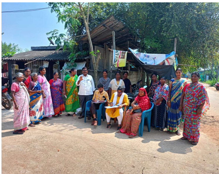
నిత్యవసర సరుకుల ధరలు తగ్గించాలి....దండు.

సత్తుపల్లి అక్టోబర్ 23 ప్రజా జ్యోతి: కేంద్రం లో సరేంద్ర మోడీ ప్రభుత్వం ప్రజా సమస్యల పరిష్కారం చేయటంలో పూర్తిగా విఫలమైందని, నిత్యవసర సరుకులు ధరలు రోజు రోజుకు