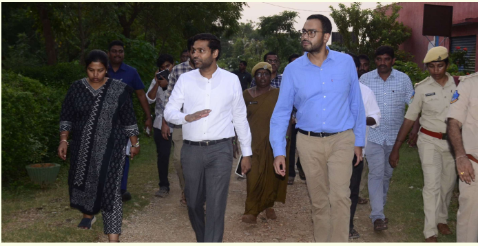
జిల్లా కలెక్టర్ ముజమ్మిల్ ఖాన్

బస్ స్టాప్ నుంచి పార్క్ కు మిని బస్ నడిపే ప్రతిపాదన పరిశీలించాలి వెలుగుమట్ల అర్బన్ పార్క్ ను పరిశీలించిన జిల్లా కలెక్టర్