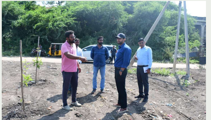
BWG ( బల్క్ వెస్టర్ జనరేటర్ ప్లాంట్ )