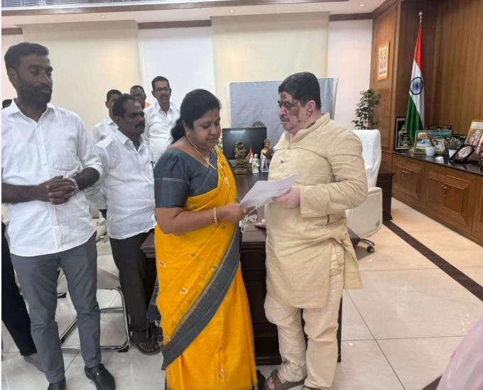
సత్తుపల్లి అక్టోబర్ 26 ప్రజా జ్యోతి.

ఆర్టీసీ కాంప్లెక్స్ సమస్యలు మంత్రికి వివరించిన ఎమ్మెల్యే