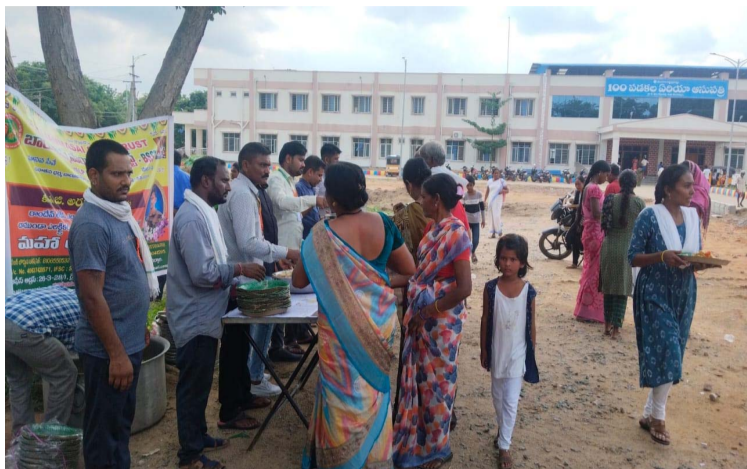
ప్రభుత్వ ఆసుపత్రిలో కార్యక్రమం