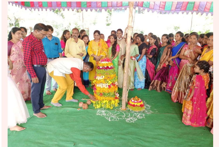
ప్రభుత్వ డిగ్రీ కళాశాలలో బతుకమ్మ సంబరాలు మహిళా సాధికారత, సాంస్కృతిక విభాగాలు, ఎన్ఎస్ఎస్ ఆధ్వర్యంలో కార్యక్రమం ఆద్యంతం ఆకట్టుకున్న విద్యార్థినుల ఆటపాటలు