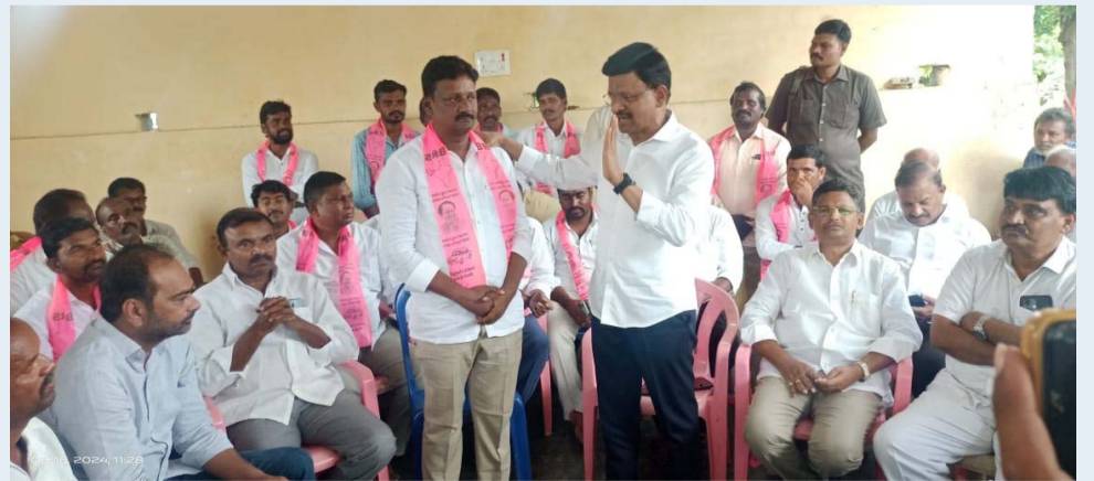
తిరుమలాయపాలెం, అక్టోబర్ 16, ప్రజా జ్యోతి :