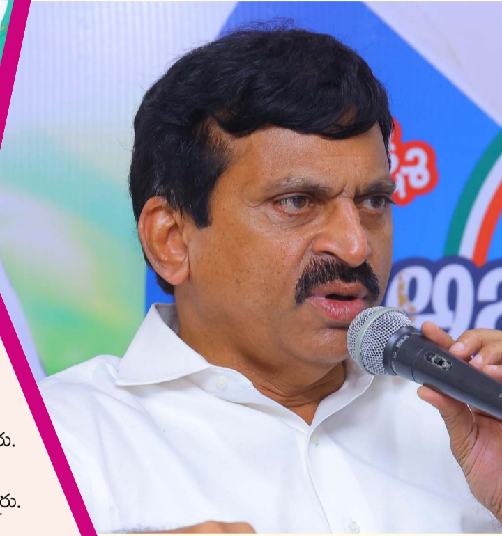
పాలేరు అక్టోబర్ 16 ప్రజా జ్యోతి

ఖమ్మం రూరల్ మండలంలో ఉన్న సమస్యల పరిష్కారానికి తీసుకోవాల్సిన చర్యలు, అభివృద్ధి కార్యక్రమాలపై అధికారులు, ప్రజా ప్రతినిధులతో సమీక్షించిన మంత్రి పొంగులేటి