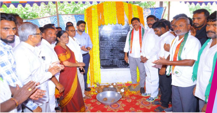
పాలేరు అక్టోబర్ 16 ప్రజా జ్యోతి

తెలంగాణ రెవెన్యూ, గృహ నిర్మాణం, సమాచార శాఖల మంత్రి పొంగులేటి శ్రీనివాస రెడ్డి 60వ డివిజన్, రామన్నపేట ఎస్సీ కాలనీలో సి.సి. కాలువ నిర్మాణ పనులకు శంకుస్థాపన