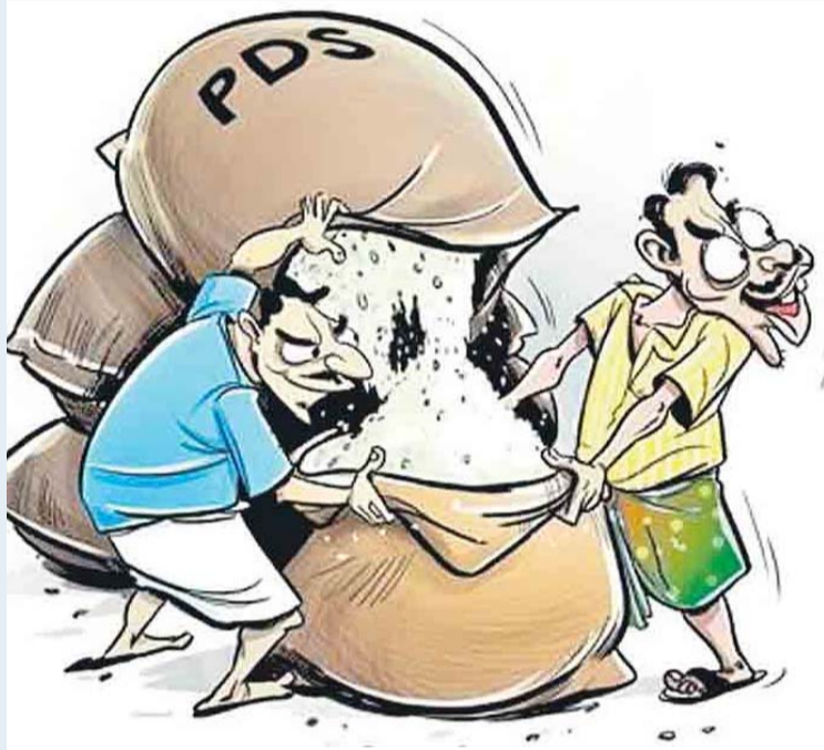
తిరుమలాయపాలెం, అక్టోబర్ 14, ప్రజా జ్యోతి :

తిరుమలాయపాలెం మండలంలోని పిండిప్రోలు, కాకరవాయి గ్రామాలు కేంద్రంగా సరిహద్దు రాష్ట్రాలకి చౌక ధరల బియ్యం తరలి పోతున్నాయి. దీనిపై అధికారులు చర్యలు తీసుకోవడం లేదు... కొందరు చౌక దుకాణదారులు, వినియోగదారులకు కిలో బియ్యానికి 10 రూపాయలు చెల్లిస్తూ వారి వద్ద నుంచి నేరుగా బియ్యం తీసుకొని దళారులకు 15, 16 రూపాయలకు అమ్ముతున్నారు. అంటే కూర్చున్న చోట నుండి కింటాకు 500 రూపాయలతో పాటు ప్రభుత్వం ఇచ్చే కమిషన్ బస్తాల విక్రయానికి ఆదాయం చౌక దుకాణదారుడుకి సమకూరుతుంది. కొంతమంది రేషన్ డీలర్లు దుకాణదారులను మధ్యపెట్టి బియ్యం బాగోలేదని చెప్పి నగదు - మిగతా3లో