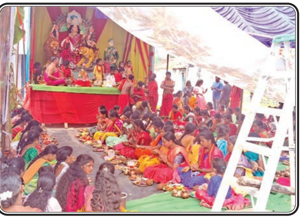
జగిత్యాల, అక్టోబర్ 8, ప్రజాజ్యోతి

రాయికల్ మండలం అల్లిపూర్ గ్రామంలో నేతాజీ యూత్ ఆధ్వర్యంలో దుర్గాదేవి నవరాత్రి ఉత్సవాల సందర్భంగా ఆడపడుచుల చేత భువనేశ్వర్ వేద పండితులు కుంకుమ పూజ నిర్వహించడం జరిగింది. ఈ కార్యక్రమంలో భువనేశ్వర్ వేదపండితులు మాట్లాడుతూ అంగరంగ వైభవంగా ప్రత్యేకమైన పూజలు చేస్తూ, కుంకుమ ఎరువు రంగులో ఉంటుంది. మరియు స్వేచ్ఛత, బలం మరియు శక్తి సూచిస్తుంది. కుంకుమ సమర్పించడం ద్వారా, భక్తులు తమ జీవితంలోని అడ్డంకులు మరియు సవాళ్లను అధిగమించే శక్తిని మరియు ధైర్యాన్ని ప్రసాదించడానికి అమ్మవారి ఆశీర్వాదాన్ని కోరుకుంటారు. కుంకుమార్చన చేయడం వల్ల తమ కోరికలు నెరవేరుతాయని భక్తులు నమ్ముతారు. కుంకుమతో పూజ చేసే ఇంటికి పట్టిన దరిద్రం వదిలిపోవడమే కాదు.. లక్ష్మీదేవి కరుణ కటాక్షాలు సిద్ధిస్తాయని వేద పండితులు చెప్పన్నారు. ఈ కార్యక్రమంలో నేతాజీ యూత్ సభ్యులు భవాని దీక్ష పరులు మరియు అధిక సంఖ్యలో ఆడపడుచులు పాల్గొని అమ్మవారి ఆశీస్సులు తీసుకోవడం జరిగింది.