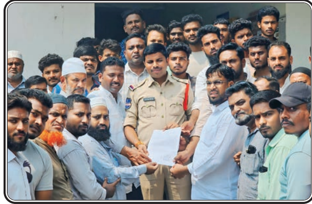
కోరుట్ల, అక్టోబర్ 8, ప్రజాజ్యోతి