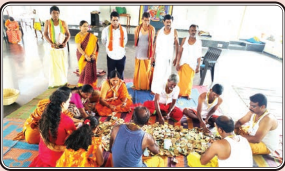
రామగిరి, అక్టోబర్ 8, ప్రజాజ్యోతి