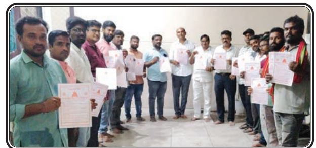
కోరుట్ల, అక్టోబర్ 8, ప్రజాజ్యోతి