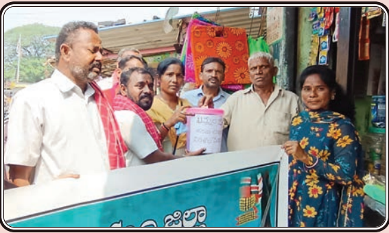
గోదావరిఖని, అక్టోబర్ 8, ప్రజాజ్యోతి