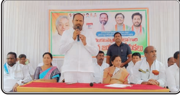
ఆంధ్రప్రదేశ్ సీఎం వైఎస్ రాజశేఖర్ రెడ్డి ని సైతం ఎదిరించి తెలంగాణ కోసం ఆరాటబడిన వ్యక్తి వెంకటస్వామి అని కొనియాడారు. పేద ప్రజల కోసం,