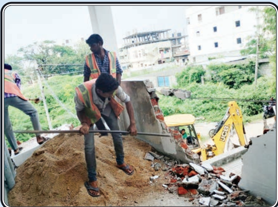
కోరుట్ల, అక్టోబర్ 5, ప్రజాజ్యోతి

కోరుట్ల మున్సిపల్ పరిధిలోని సాయిరాం పురా కాలనీలో అనుమతికి విరుద్ధంగా నిర్మిస్తున్న భవన నిర్మాణాన్ని కోర్టు ఉత్తర్వుల మేరకు ఎన్ఫోర్స్మెంట్ అధికారులు కూల్చివేశారు. తెలంగాణ బీ.ఎస్.డీ.ఎస్. అనుమతి పొందిన భావన యాజమాన్యలు అనుమతి తీసుకున్న ప్లాన్ ప్రకారం నిర్మించావలసిందిగా మున్సిపల్ అధికారులు కోరారు. అలాగే అనుమతి లేకుండా అక్రమ నిర్మాణాలు చేపడుతే 2019 నూతన మున్సిపల్ చట్టం ప్రకారం చర్యలు తీసుకోబడుతాయి. ఇంటి నిర్మాణంలో ప్రతి ఒక్కరు ప్రభుత్వ నిబంధనల పాటించాలని సూచించారు. ఇట్టి కార్యక్రమంలో మున్సిపల్, ఎన్ఫోర్స్మెంట్ అధికారులు పాల్గొన్నారు