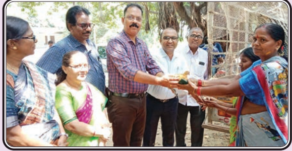
రామగిరి, అక్టోబర్ 5, ప్రజాజ్యోతి