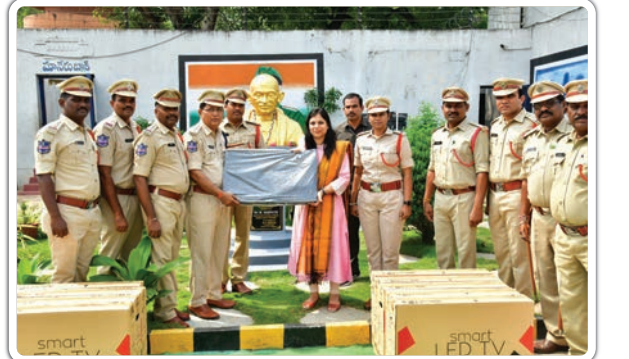
కరీంనగర్ కైం, అక్టోబర్ 29, ప్రజాజ్యోతి