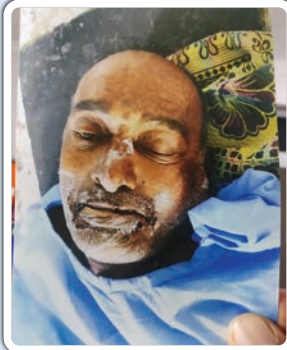
కొడిమ్యాల, అక్టోబర్ 29, ప్రజాజ్యోతి