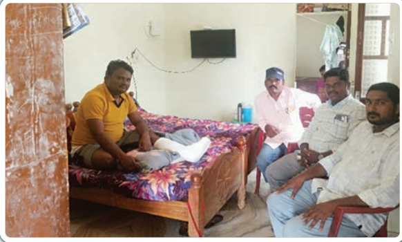
సైదాపూర్, అక్టోబర్ 29, ప్రజాజ్యోతి