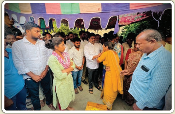
కోడిమూల, అక్టోబర్ 27, (ప్రజాజ్యోతి):