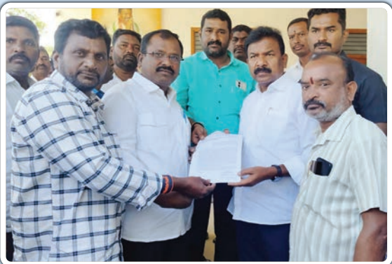
హుజురాబాద్, అక్టోబర్ 26, ప్రజాజ్యోతి:

నివేశన స్థలాల సమస్యను పరిష్కరించాలని విజ్ఞప్తి