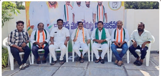
కోరుట్ల, అక్టోబర్ 26, ప్రజాజ్యోతి

- సూటిగా ప్రశ్నించిన జువ్వాడి కృష్ణారావు