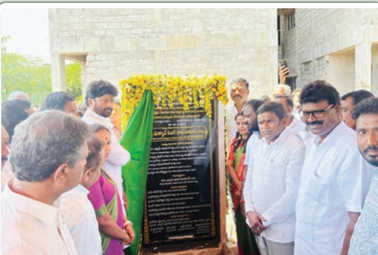
గోదావరిఖని, అక్టోబర్ 26, ప్రజాజ్యోతి