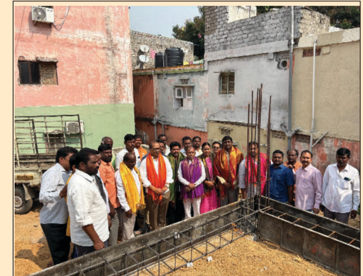
కూకట్ పల్లి, అక్టోబర్ 25 (ప్రజా జ్యోతి) :