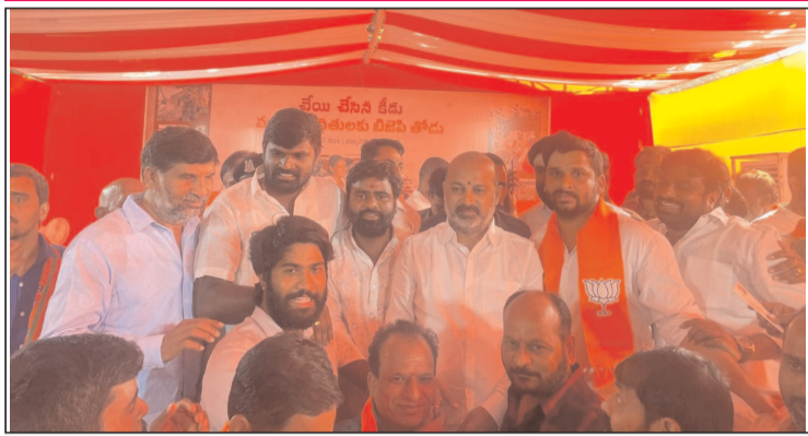
- మహాధర్మాలో పాల్గొన్న చేవెళ్ల బిజెపి నాయకులు