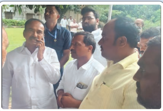
జమ్మికుంట, అక్టోబర్ 22, ప్రజాజ్యోతి

గులియన్ బేరో సిండ్రోమ్ వ్యాధి చికిత్సకి 20 లక్షలు అవసరం వైద్యం ఖర్చునేనే భరిస్తా.. మాజీ మంత్రి ఈటల రాజేందర్