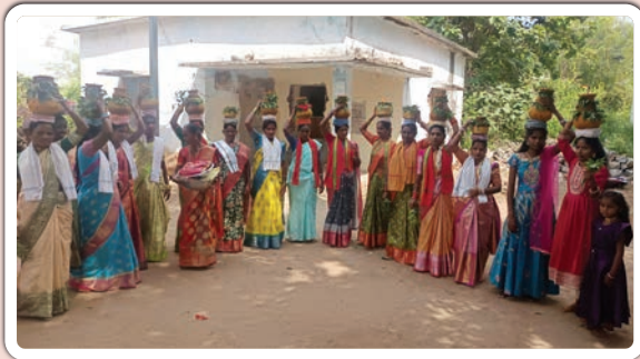
జగిత్యాల, అక్టోబర్ 22, ప్రజాజ్యోతి