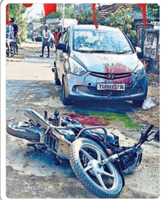
జగిత్యాల, అక్టోబర్ 22, ప్రజాజ్యోతి