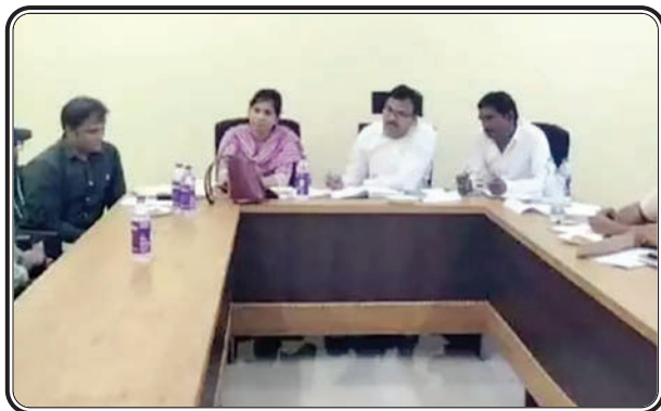
హుజూరాబాద్, అక్టోబర్ 21, ప్రజాజ్యోతి