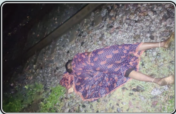
జమ్మికుంట, అక్టోబర్ 21