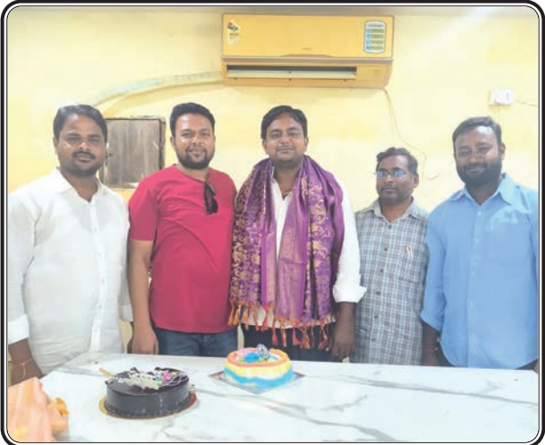
కోరుట్ల, అక్టోబర్ 21, ప్రజాజ్యోతి