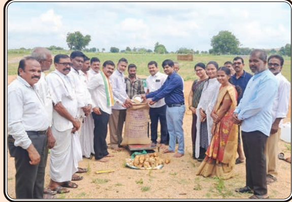
చిగురుమామిడి, అక్టోబర్ 21, ప్రజాజ్యోతి

సుందరగిరిలో వరి ధాన్యం కొనుగోలు కేంద్రాన్ని ప్రారంభించిన అధికారులు