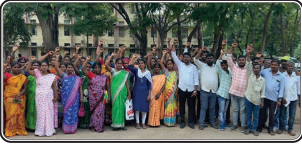
జమ్మికుంట, అక్టోబర్ 21 (ప్రజాజ్యోతి):

హుజూరాబాద్ నియోజకవర్గంలో గత తెలంగాణ ప్రభుత్వం పైలట్ ప్రాజెక్టు కింద దళితులకు అందించిన దళిత బంధు రెండో విడత నిధులు త్వరగా విడుదల చేయాలని కరీంనగర్ జిల్లా కలెక్టరేట్ ప్రజావాణిలో దరఖాస్తు చేసినట్లుగా దళిత బంధుసాధన సమితి సభ్యులు తెలిపారు.. కరీంనగర్ కలెక్టరేట్ సోమవారం నిర్వహించే ప్రజావాణి కార్యక్రమానికి హుజూరాబాద్ నియోజకవర్గం నుండి సుమారు 200