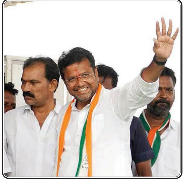
రామగిరి, అక్టోబర్ 20 (ప్రజాజ్యోతి):

- త్వరలో నియోజకవర్గంలో 4వేల ఇందిరమ్మ ఇండ్లు - కష్టకాలంలో కాంగ్రెస్ జెండా మోసినవారికే ఇందిరమ్మ కమిటీలో చోటు - రాష్ట్ర ఐటి, పరిశ్రమలు, శాసనసభ వ్యవహారాల శాఖ మంత్రి దుద్దిళ్ళ శ్రీధర్ బాబు