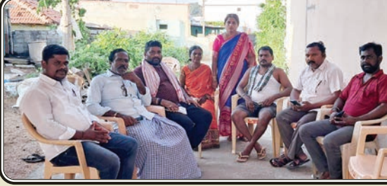
చిగురుమామిడి, అక్టోబర్ 20, ప్రజాజ్యోతి