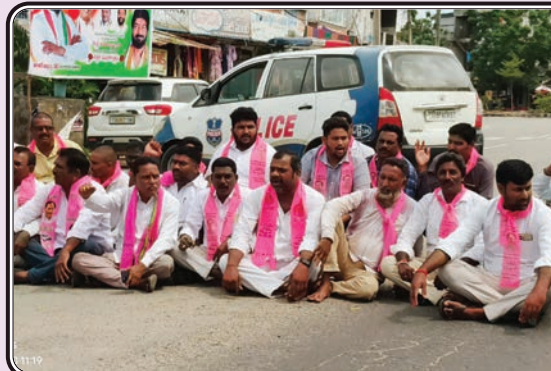
సుల్తానాబాద్, అక్టోబర్ 20, ప్రజాజ్యోతి

రైతులను మోసం చేస్తే ఊరుకునేది లేదు మాజీ ఎంపీపీ బాలాజీ రావు