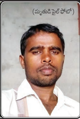
(మృతుడి ఫైల్ ఫోటో)