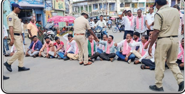
కాంగ్రెస్ ప్రభుత్వ వైఖిరికి నిరసన సెగ