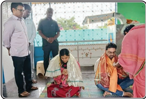
హుజురాబాద్, అక్టోబర్ 20, ప్రజాజ్యోతి

భక్తుల కొంగుబంగారంగా భావింపే హుజురాబాద్ మున్సిపల్ పరిధిలోని కొత్తపల్లిలోని నవగ్రహ సహిత శ్రీ నాగేంద్ర స్వామి దేవాలయంలో కరీం నగర్, అమరావతికి చెందిన ఐఏఎస్ మిత్రులు ప్రత్యేక పూజలు నిర్వహించారు.