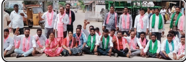
జగిత్యాల, అక్టోబర్ 20, ప్రజాజ్యోతి

వానకాలం ఖిర్ఖానా సీజన్ లో రైతులకు ఇవ్వాలిని రైతుభరోసా ఇవ్వమని ఎగవేసిన కాంగ్రెస్ ప్రభుత్వ తీరును నిరసిస్తూ ఆదివారం రాయకల్ మండల కేంద్రంలో నిరసన కార్యక్రమం చేపట్టిన బీఆర్ఎస్ శ్రేణులు.. ఎకరానికి 15 వేల రైతు భరోసా ఇస్తామని అసెంబ్లీ ఎన్నికల్లో రైతులను మోసం చేసిన కాంగ్రెస్ తీరుని ఎండగట్టాలని పచ్చి అబద్ధాలు, మోసాలతో రైతులను కాంగ్రెస్ ప్రభుత్వం రైతులను దగా చేసిందని మండిపడ్డారు. రుణమాఫీ మోసం చాలదన్నట్లు... ఇప్పుడు రైతు భరోసాలోనూ దగా చేస్తున్నారని బీఆర్ఎస్ శ్రేణులు ఆగ్రహం వ్యక్తం చేశారు. ఎట్టి పరిస్థితుల్లో రైతులకు వెట్టుబడి సాయం ఇవ్వాలిందేనని డిమాండ్ చేశారు. లేదంటే ఎక్కడికక్కడ మీ ప్రజా ప్రతినిధులను ప్రజల్లో నిలదీసారని హెచ్చరించారు. రైతులకు బీఆర్ఎస్ అండగా ఉంటుందని.. రైతు భరోసా ఇచ్చే వరకు కాంగ్రెస్ వదిలేదీ లేదని స్పష్టం చేశారు. ఈ కార్యక్రమంలో రాయకల్ మండల మరియు పట్టణ BRS నాయకులు మరియు రైతులు పాల్గొన్నారు.