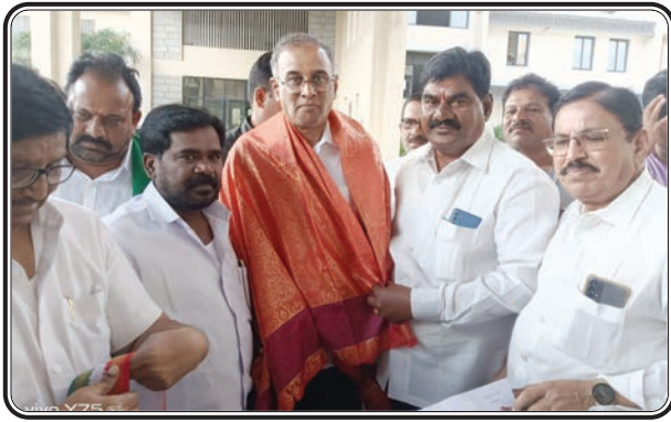
పాల్వంచ, అక్టోబర్ 19, ప్రజాజ్యోతి

దిశ సమావేశానికి పాల్వంచకు విచ్చేసిన ఖమ్మం పార్లమెంటు సభ్యులు రామసహాయం రఘురాం రెడ్డి, మామబాబాబాద్ పార్లమెంట్ సభ్యులు పోరీక బలరాం నాయక్,