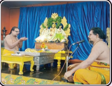
భద్రాచలం, అక్టోబర్ 19, ప్రజాజ్యోతి

భద్రాచలం శ్రీసీతారామ చంద్రస్వామి ఆలయంలో స్వామివారి ఉత్సవ మూర్తులకు శనివారం అర్చకులు స్వర్ణ తులసి పూజలు జరిపారు. తెల వారుజామున ఆలయ తలుపులు తెరిచి