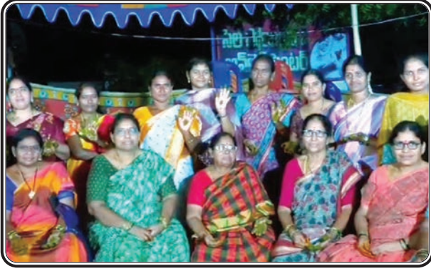
టేకులపల్లి, అక్టోబర్ 19, ప్రజాజ్యోతి:

ఈ ఉప్పులగుప్ప అటలు.. ఆనాటి పాటలు.. ఆ సాంప్రదాయక పద్ధతులు?? అట్లతద్దె అంటే ఓ రెంజ్ లో ఉండేది..