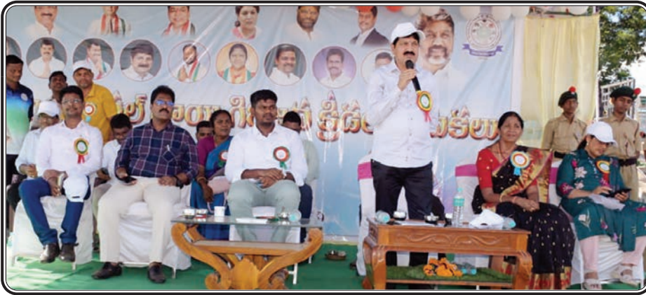
పాల్వంచ, అక్టోబర్ 19, ప్రజాజ్యోతి