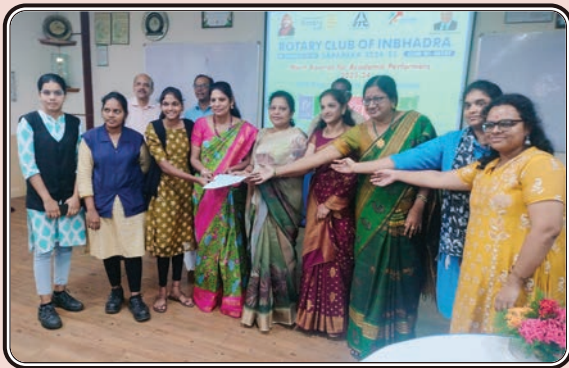
బూర్గంపాడు, అక్టోబర్ 19