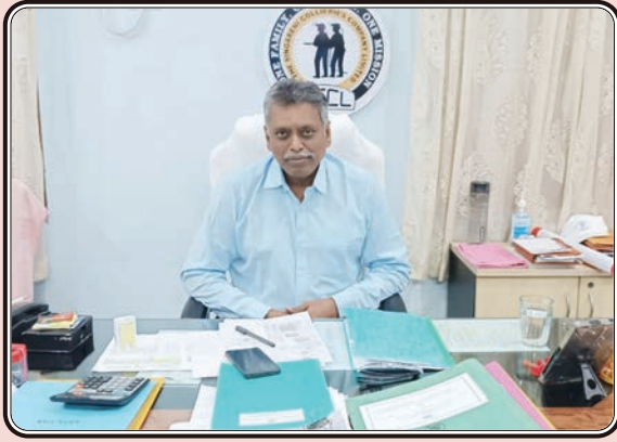
ఇల్లందు, అక్టోబర్ 19, ప్రజాజ్యోతి: