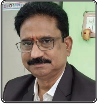
(మొదటి పేజీ తరువాయి...)

రహదారి అయిన భద్రాచలం చర్ల మార్గం గుంతలమయంగా ఉండి ప్రయాణీకులకు సరకప్రాయంగా మారింది. భద్రాచలం నుండి పర్లకాలవరకు సుమారు 35 కిమీ ఉండే ఈ రహదారి, భద్రాచలం పట్టణ పరిధిలోని రాజుపేట నుండి మొదలు కన్నాయిగూడెం గ్రామ శివారులోని తూరుబాక బ్రిడ్జి వరకు సుమారు 5 కిమీ మేర ఏపీ పరిధిలోకి వస్తుంది. రాష్ట్ర విభజన నాటి నుండి ఏపీ పరిధిలోకి పోయిన ఆ రహదారి మరమ్మత్తులు నేటికీ చేపట్టకపోవడంతో సుమారు 5 కిమీ రహ