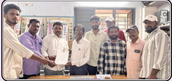
పాల్వంచ, అక్టోబర్ 19, ప్రజాజ్యోతి:

- ఎంఈఓ కు వినతి పత్రం అందజేసిన బీజేపీ నాయకులు