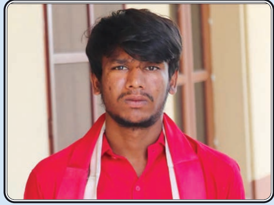
జూలూరుపాడు, అక్టోబర్ 19, ప్రజా జ్యోతి